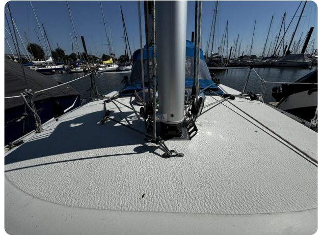
Albin Express 3