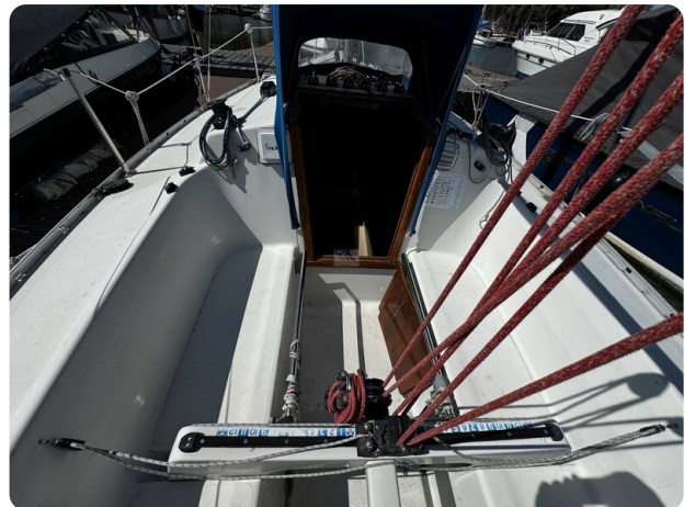
Albin Express 27