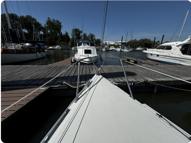
Albin Express 2