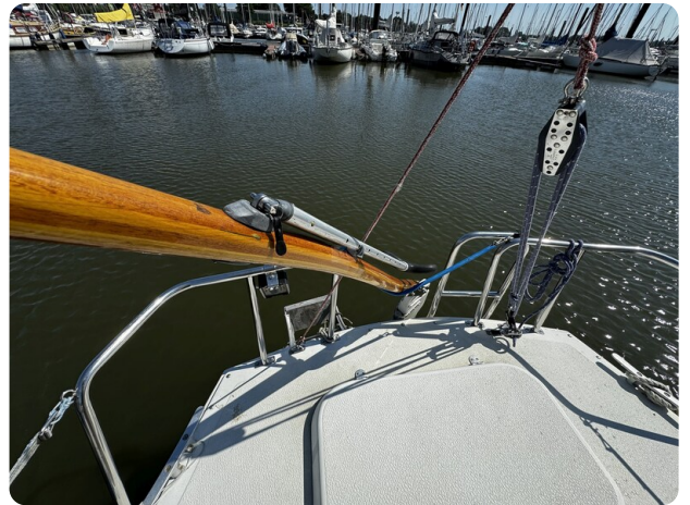
Albin Express 19