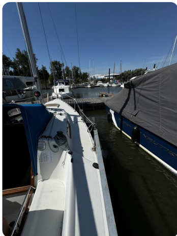
Albin Express 20