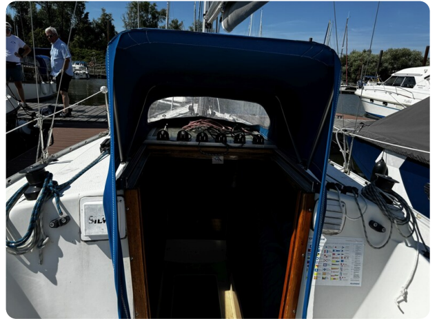
Albin Express 28