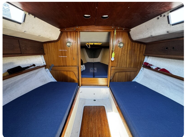
Albin Express 9