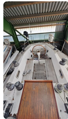
Feltz Alu One Off_27