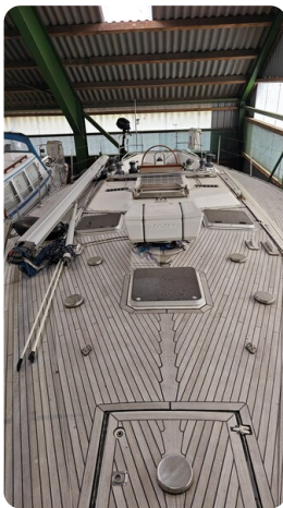
Feltz Alu One Off_15