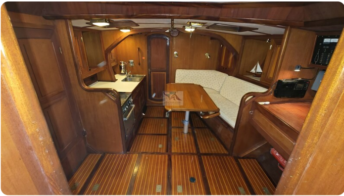
Feltz Alu One Off_39