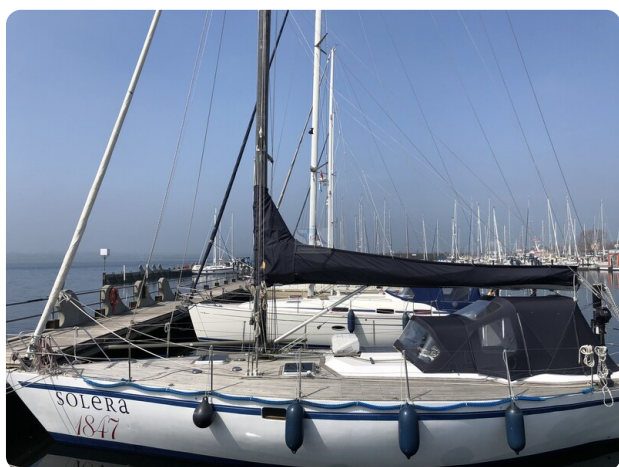
Feltz Alu One Off_113