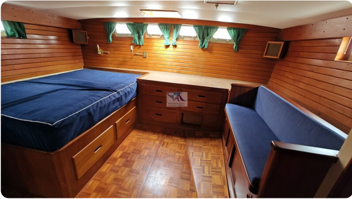
Grand Banks 48_msp789980 50