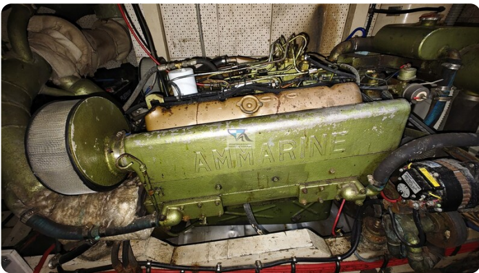
Grand Banks 48_msp789980 6