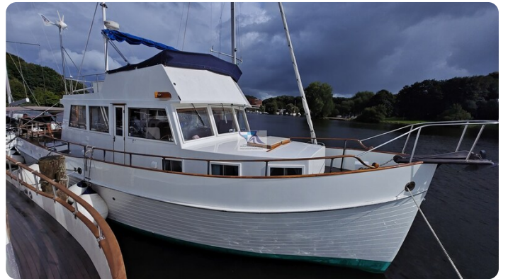
Grand Banks 48_msp789980 66