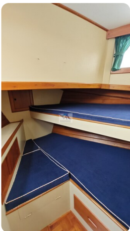
Grand Banks 48_msp789980 31