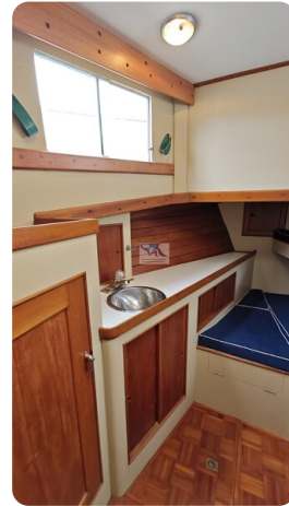
Grand Banks 48_msp789980 29