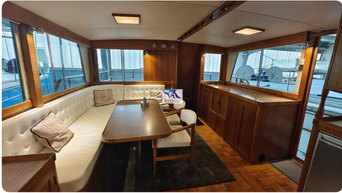
Grand Banks 48_msp789980 85