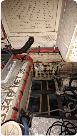
Grand Banks 48_msp789980 10