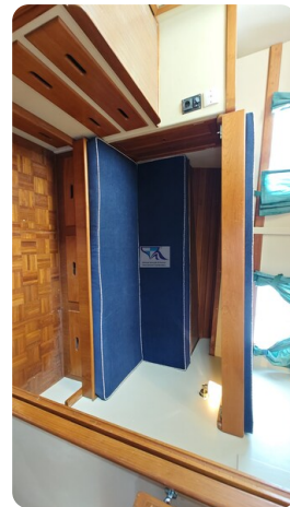
Grand Banks 48_msp789980 22