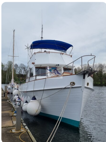
Grand Banks 48_msp789980 2