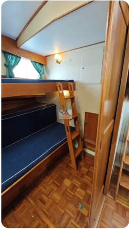
Grand Banks 48_msp789980 23