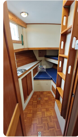
Grand Banks 48_msp789980 25