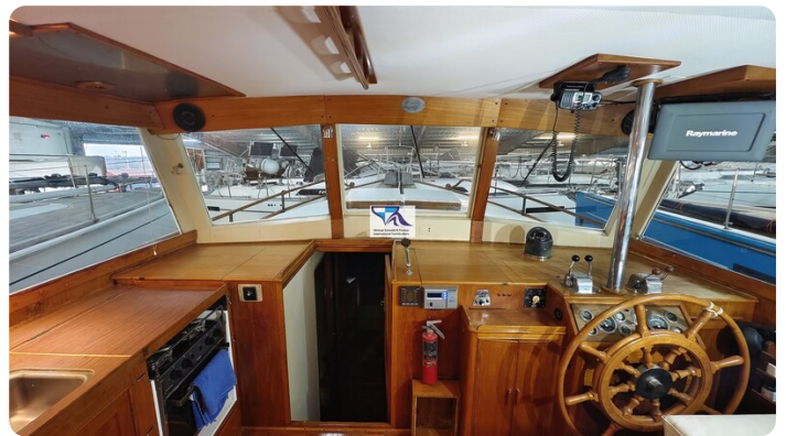
Grand Banks 48_msp789980 92