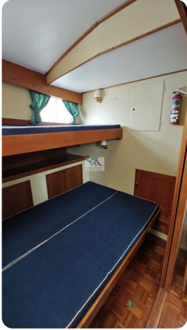
Grand Banks 48_msp789980 17