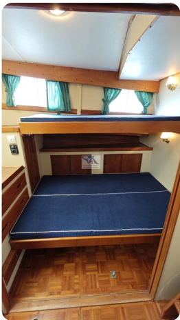
Grand Banks 48_msp789980 19