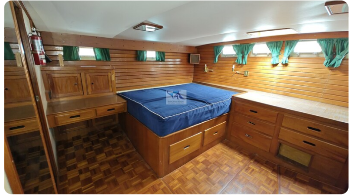
Grand Banks 48_msp789980 48