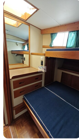
Grand Banks 48_msp789980 18