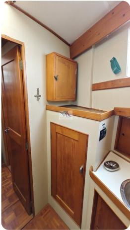
Grand Banks 48_msp789980 27