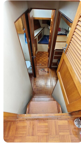
Grand Banks 48_msp789980 16