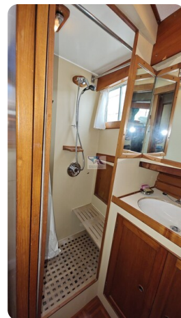
Grand Banks 48_msp789980 41