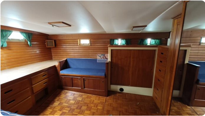
Grand Banks 48_msp789980 51