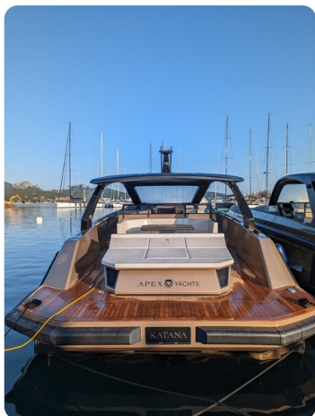
Apex 60 stern view