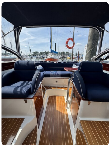
Aquador 23 DC SUND 43