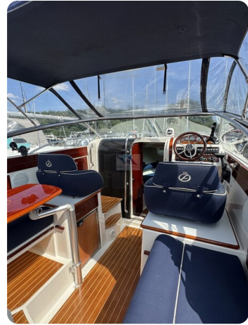
Aquador 23 DC SUND 22