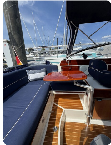
Aquador 23 DC SUND 24