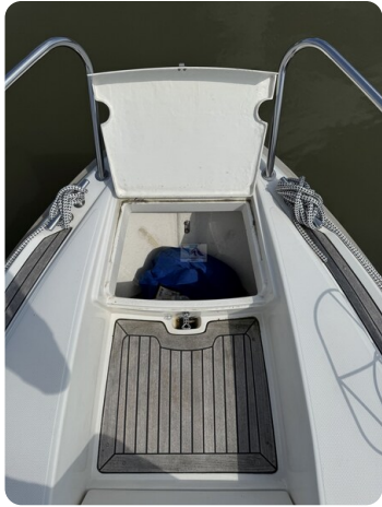
Aquador 23 DC SUND 27