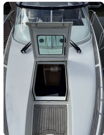
Aquador 23 DC SUND 29