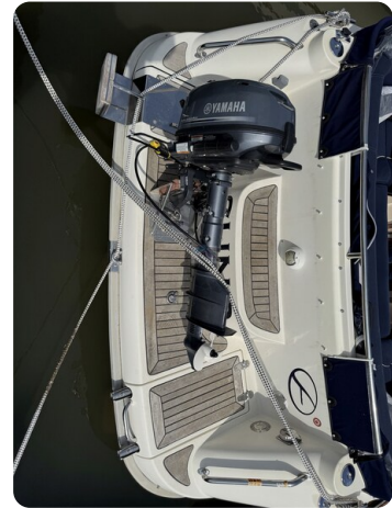
Aquador 23 DC SUND 5