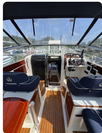
Aquador 23 DC SUND 42