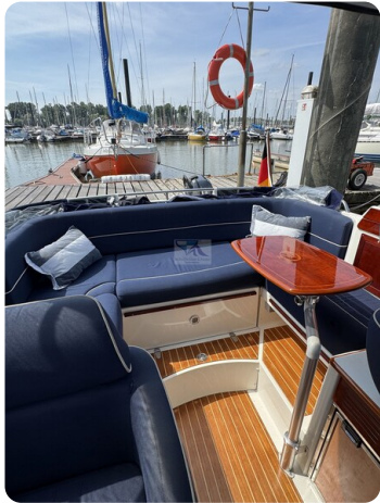
Aquador 23 DC SUND 25