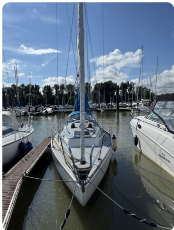
S & S 30 IVALU 4