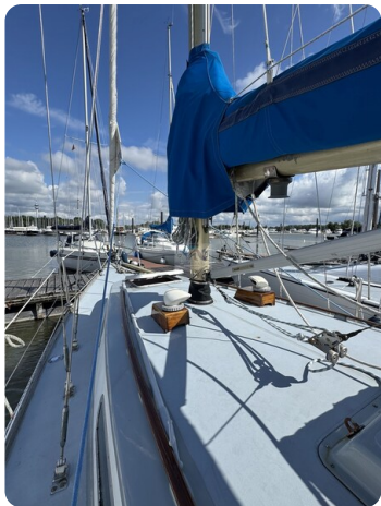
S & S 30 IVALU 34