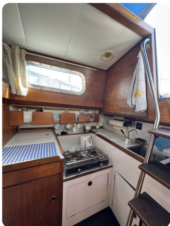
S & S 30 IVALU 62