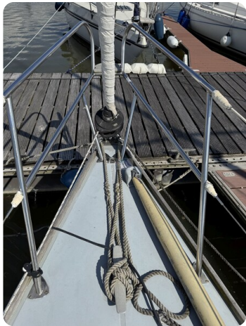
S & S 30 IVALU 40