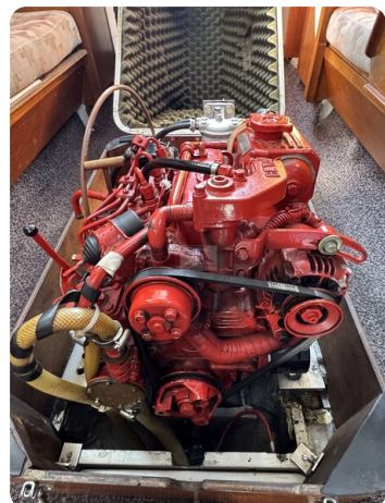
S & S 30 IVALU 27