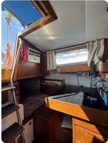
S & S 30 IVALU 51