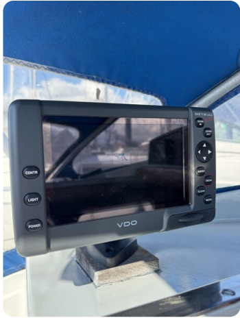
S & S 30 IVALU 31