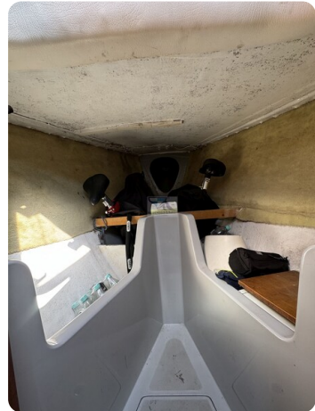
S & S 30 IVALU 57