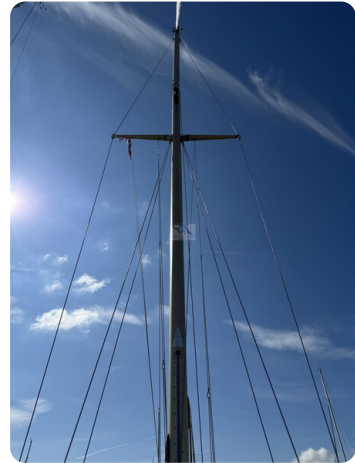
S & S 30 IVALU 35