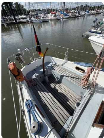
S & S 30 IVALU 14