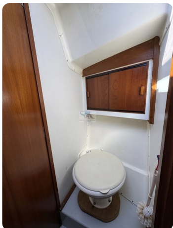
S & S 30 IVALU 55