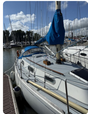
S & S 30 IVALU 3