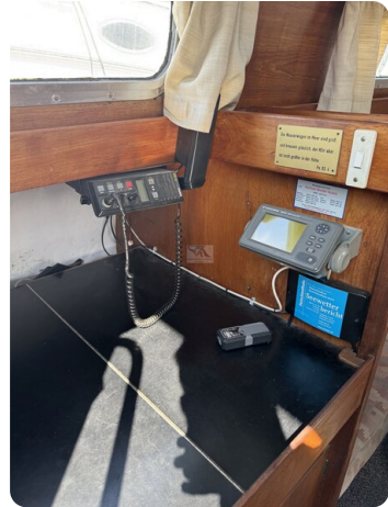
S & S 30 IVALU 50