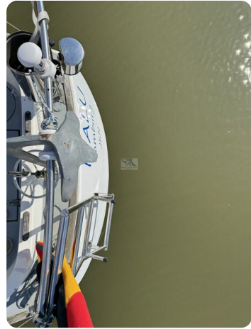
S & S 30 IVALU 11