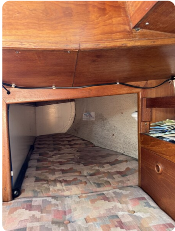
S & S 30 IVALU 1