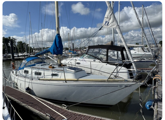
S & S 30 IVALU 7