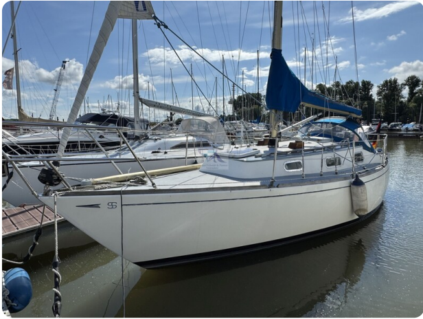
S & S 30 IVALU 5