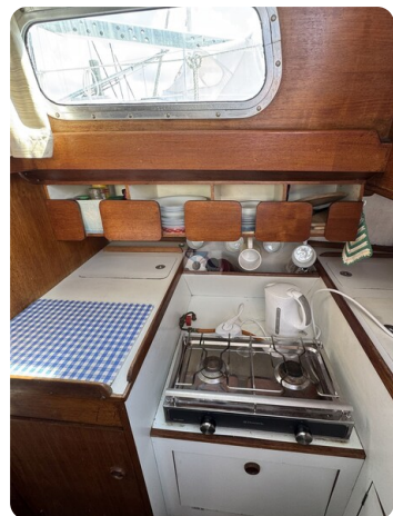
S & S 30 IVALU 49