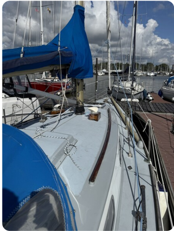
S & S 30 IVALU 10