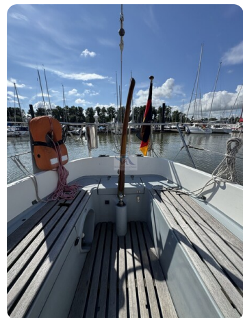
S & S 30 IVALU 12