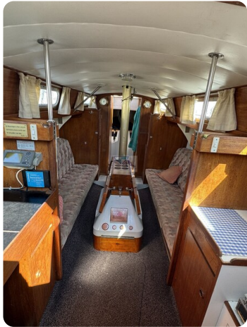
S & S 30 IVALU 33