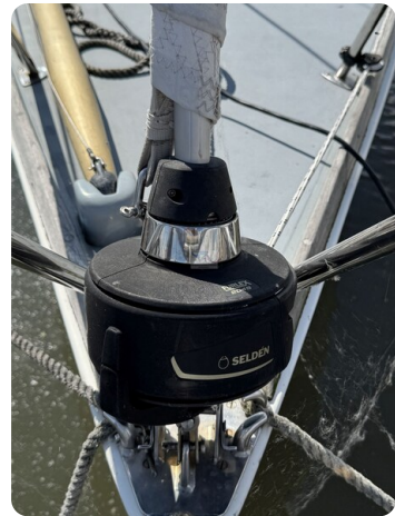
S & S 30 IVALU 2