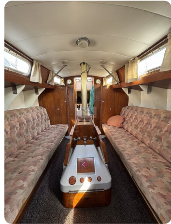
S & S 30 IVALU 61