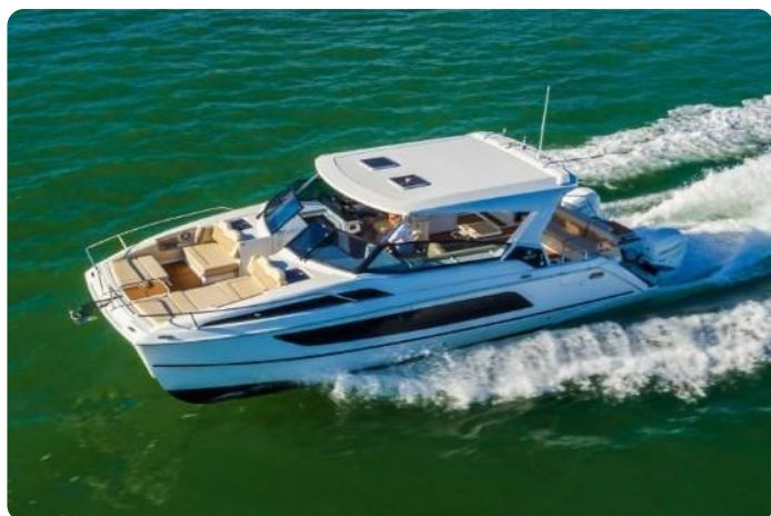
Aquila 36 Sport sistership