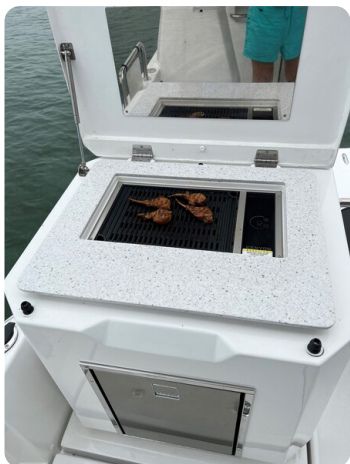
Aquila 36 Sport cockpit grill