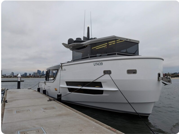
CIAO! profile fwd