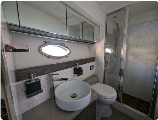
AP 44 Sedan owner's bathroom