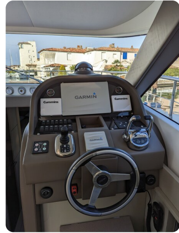
AP 44 Sedan helm