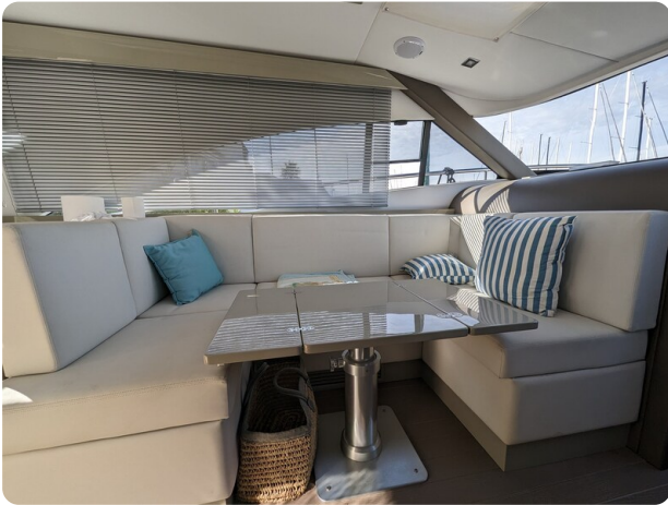
AP 44 Sedan dinette