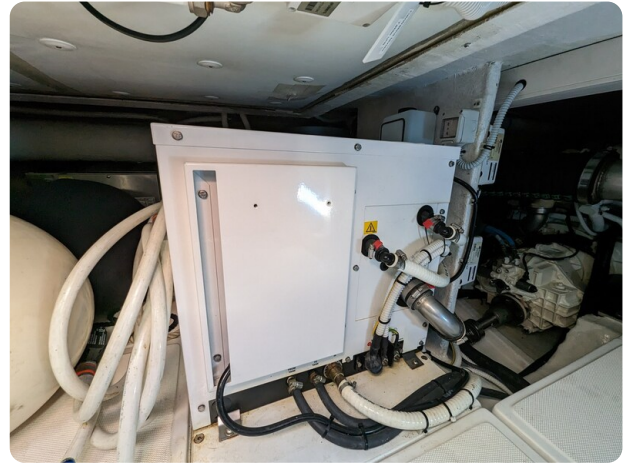
AP 44 Sedan generator