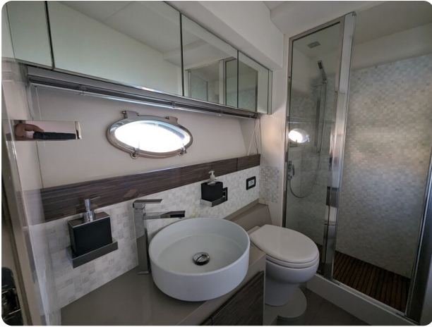
AP 44 Sedan owner's bathroom