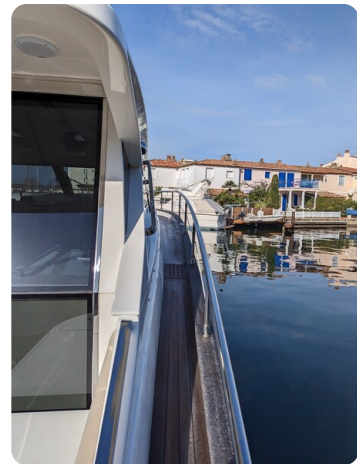
AP 44 Sedan sideways