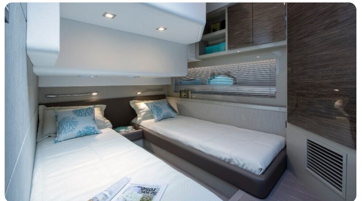
AP 44 Sedan guest cabin