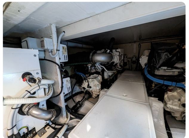
AP 44 Sedan engine room detail