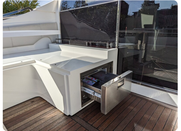
AP 44 Sedan cockpit refrigerator