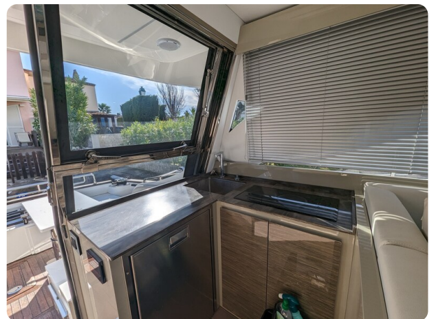
AP 44 Sedan galley