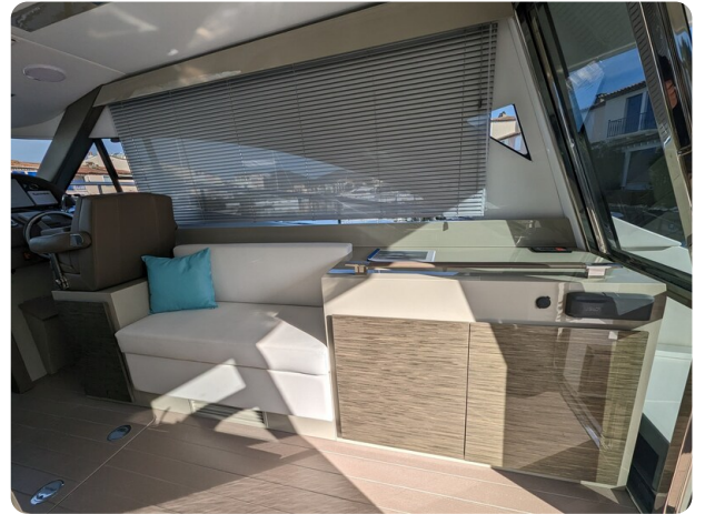
AP 44 Sedan interior detail