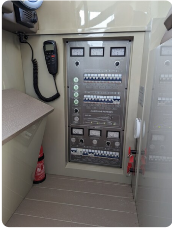
AP 44 Sedan electrical panel