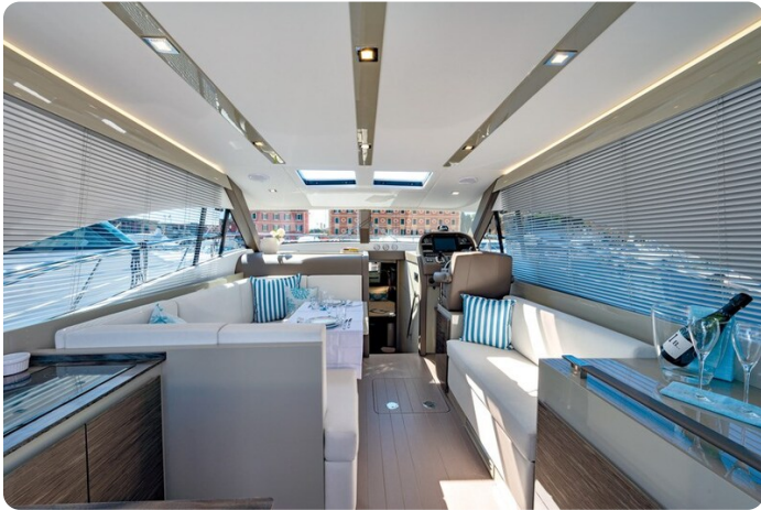
AP 44 Sedan salon