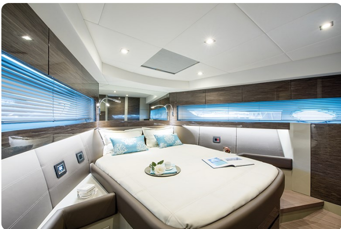
AP 44 Sedan owner's cabin