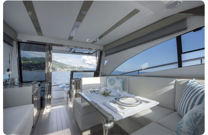
AP 44 Sedan salon to aft