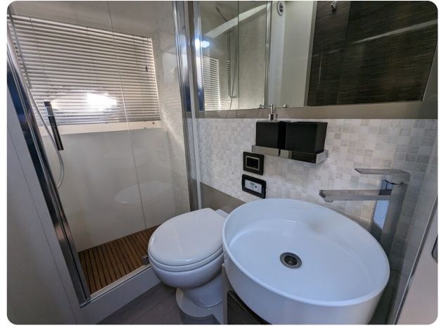
AP 44 Sedan guest bathroom