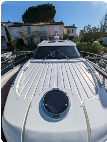
AP 44 Sedan fwd deck