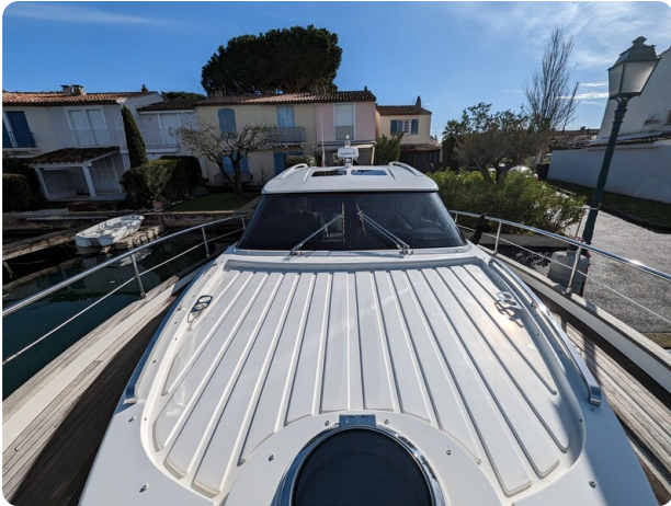
AP 44 Sedan fwd sunpad