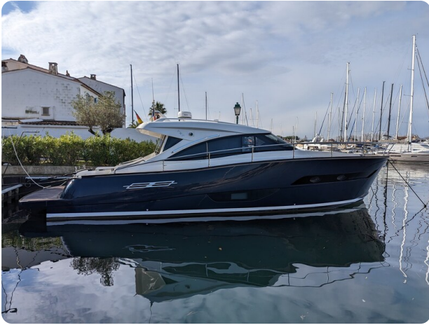
AP 44 Sedan profile