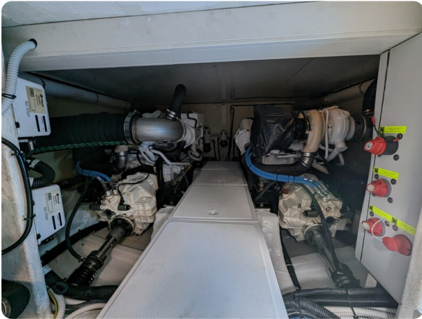
AP 44 Sedan engine room