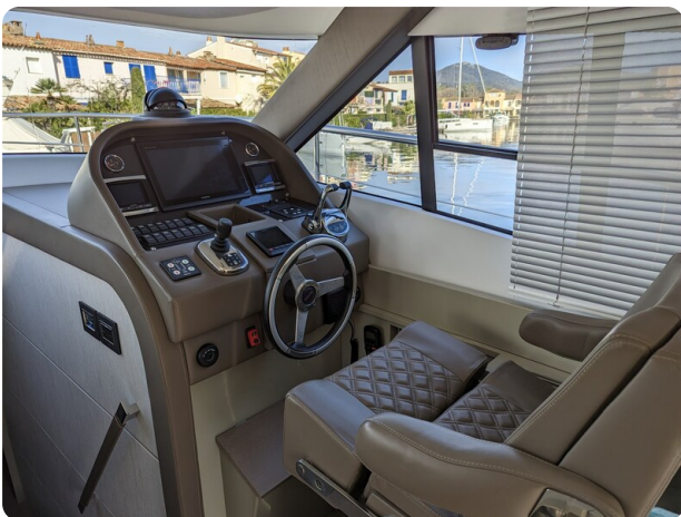
AP 44 Sedan helm station