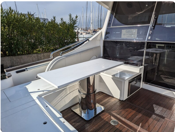
AP 44 Sedan cockpit dinette