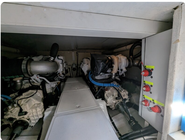
AP 44 Sedan engines detail