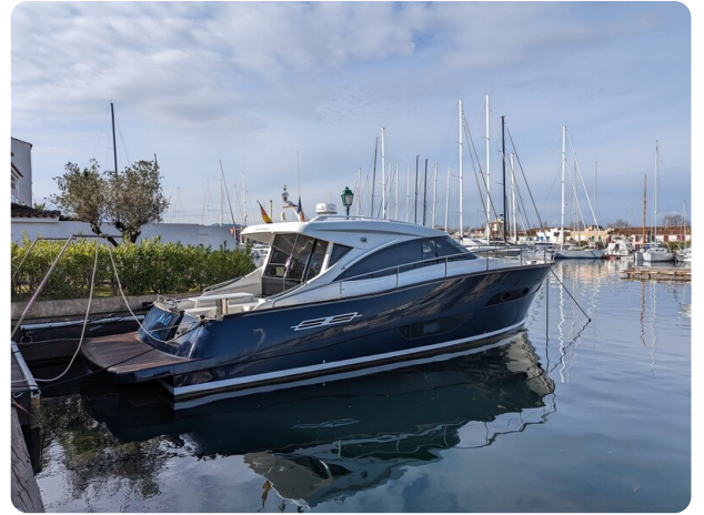
AP 44 Sedan aft profile