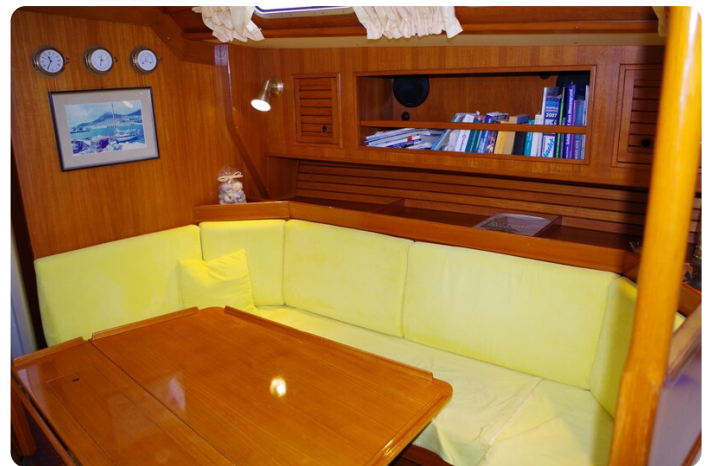
Avance 40 msp636285 14