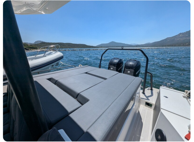
Axopar 37 Sun Top Brabus, aft sunpad