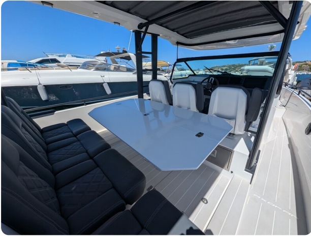
Axopar 37 Sun Top Brabus, cockpit dinette