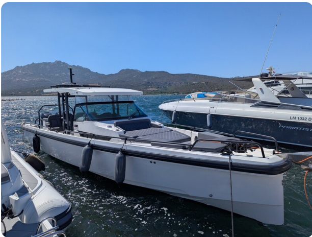
Axopar 37 Sun Top Brabus, bow view