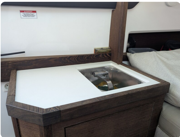
Axopar 37 Sun Top Brabus, cabin detail