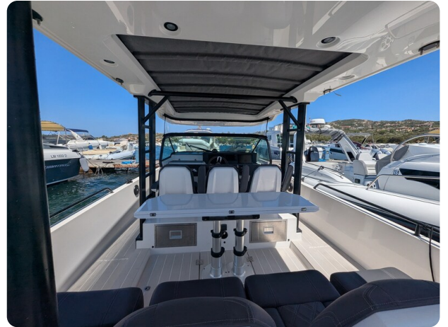
Axopar 37 Sun Top Brabus, cockpit lounge