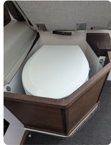
Axopar 37 Sun Top Brabus, head