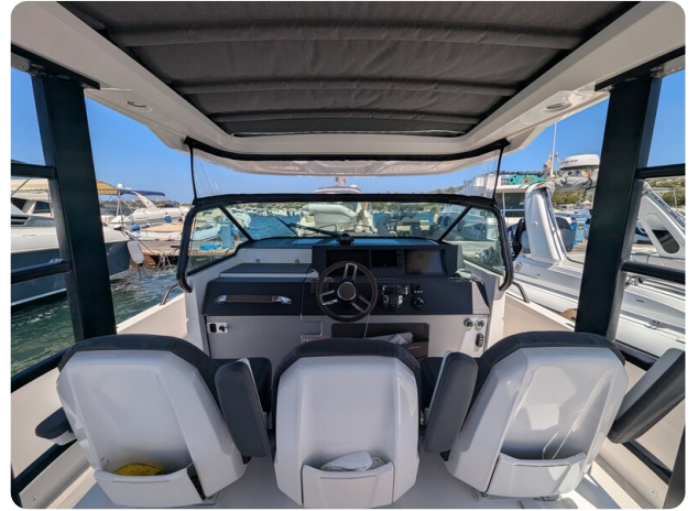
Axopar 37 Sun Top Brabus, helm station