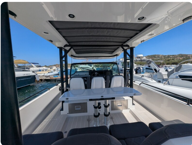
Axopar 37 Sun Top Brabus, cockpit view