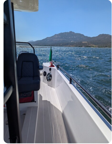
Axopar 37 Sun Top Brabus, side view