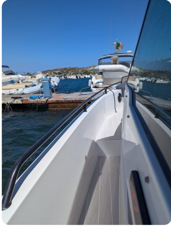
Axopar 37 Sun Top Brabus, port side view