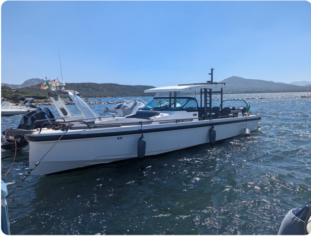
Axopar 37 Sun Top Brabus, bow profile