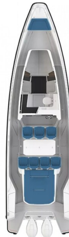
Axopar 37 layout