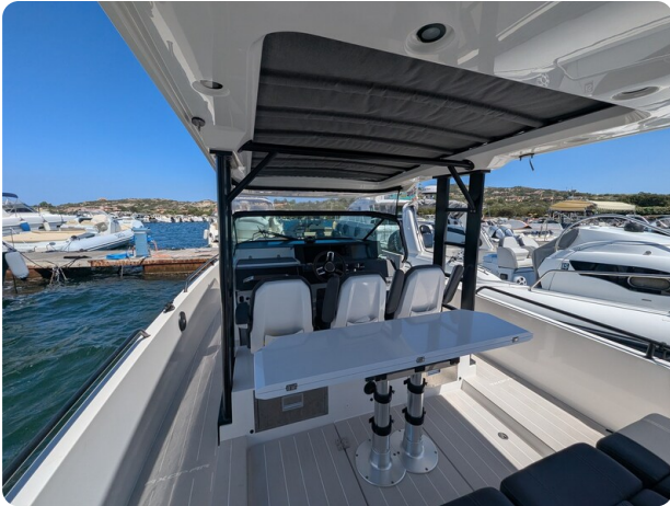
Axopar 37 Sun Top Brabus, cockpit area