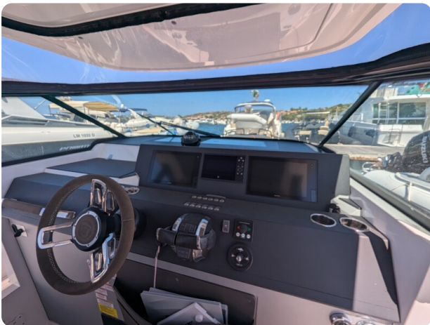
Axopar 37 Sun Top Brabus, helm