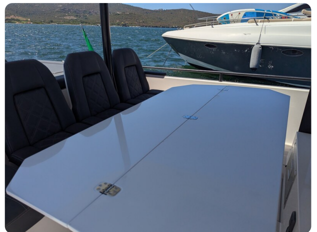
Axopar 37 Sun Top Brabus, table detail