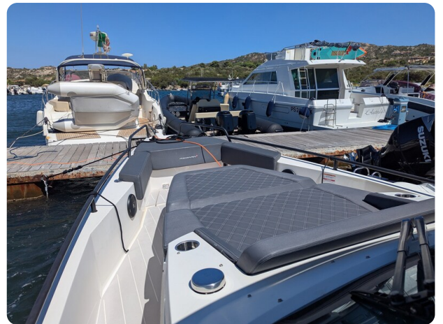
Axopar 37 Sun Top Brabus, bow sunpad