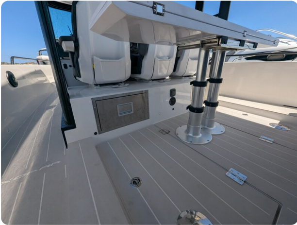
Axopar 37 Sun Top Brabus, cockpit floor detail