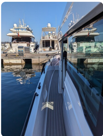
Axopar 37 XC side ways