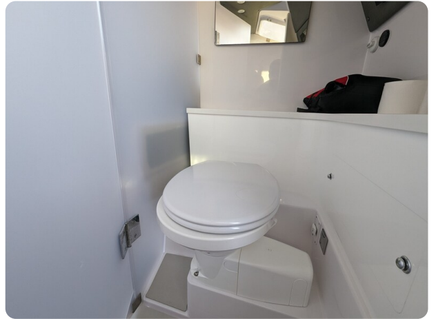
Axopar 37 XC head