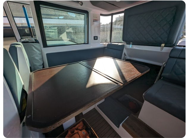
Axopar 37 XC dinette