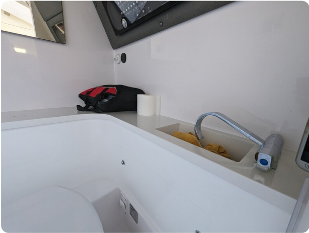
Axopar 37 XC bathroom