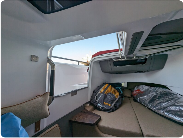
Axopar 37 XC cabin side door