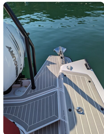
Axopar 37 XC stern detail