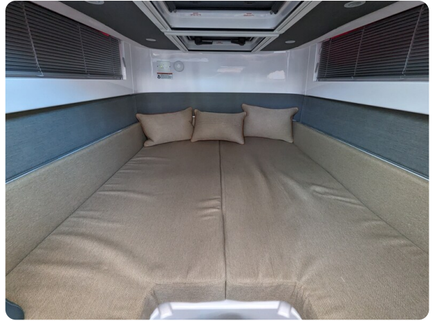
Axopar 37 XC aft cabin