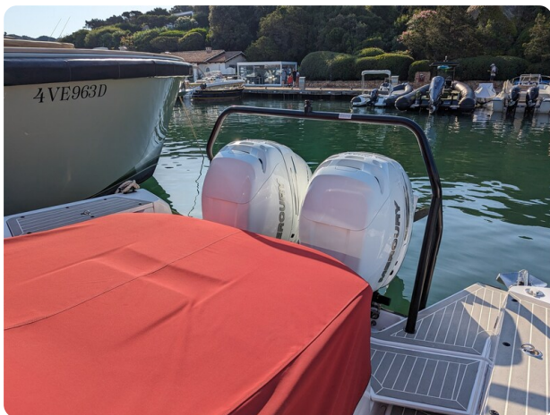
Axopar 37 XC cockpit