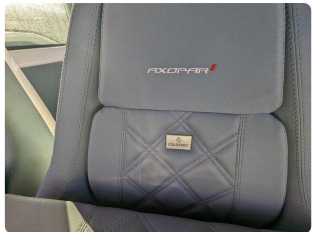
Axopar 37 XC details