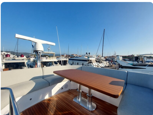
Azimut 53 Fly El Bibes-9