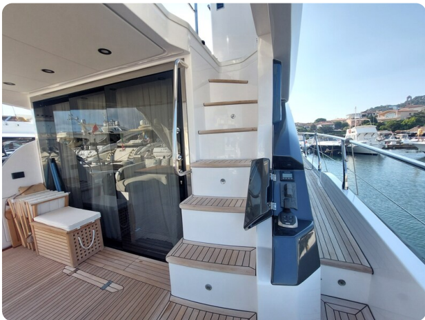
Azimut 53 Fly cockpit detail