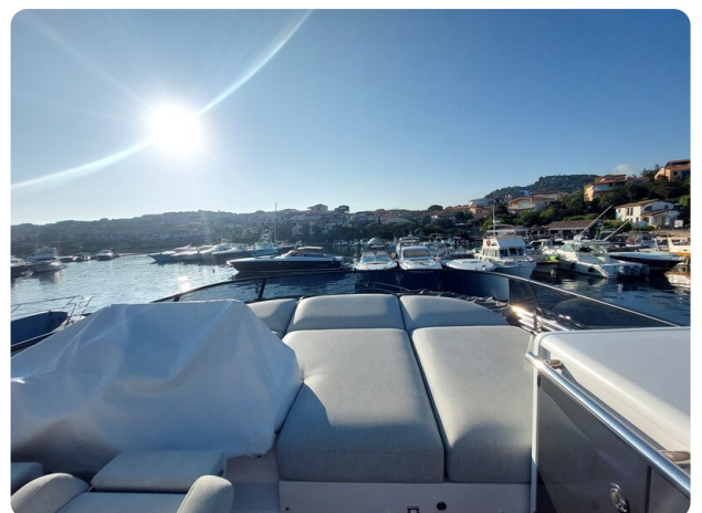
Azimut 53 Fly El Bibes-8