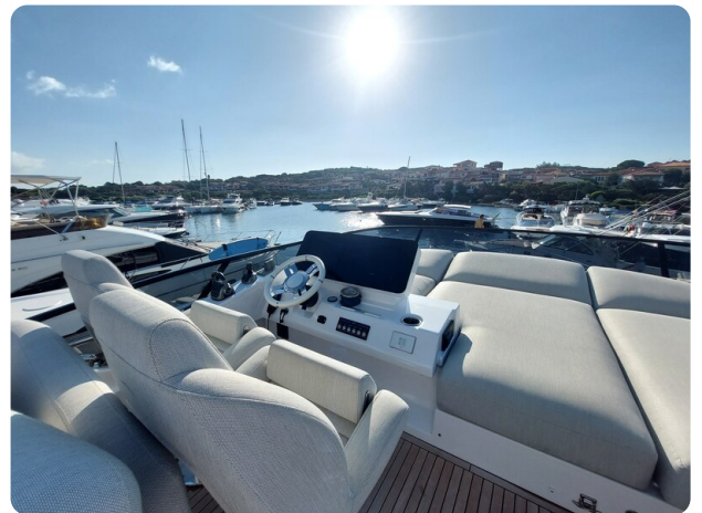
Azimut 53 Fly helm station