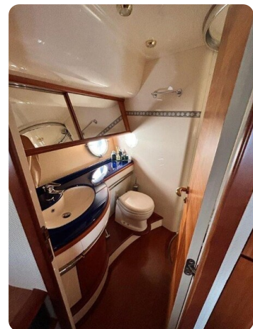
Az 62 Bagno cabina Vip prua