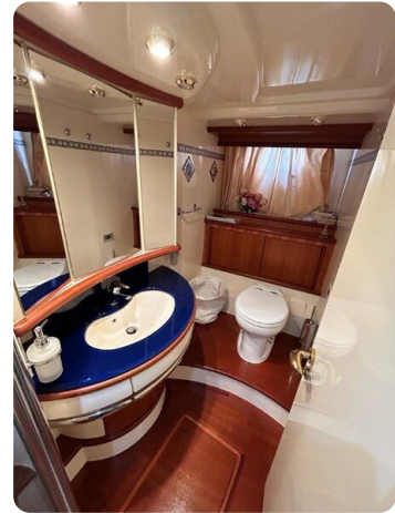
Az 62 Bagno armatore (1)