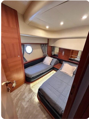
Az 62 Cabina ospiti letti doppi