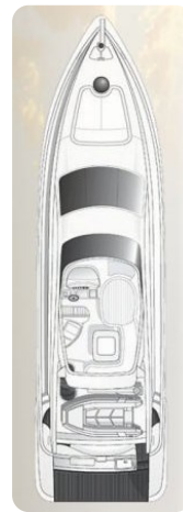
Layout Az 62