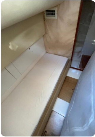
Az 62 Cabina marinaio