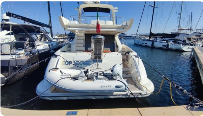
Az 62 Vista poppa