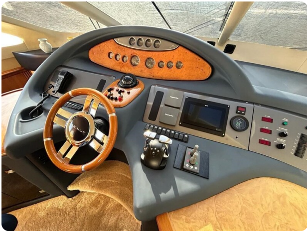
Az 62 Plancia Azimut 62 - dinette.1