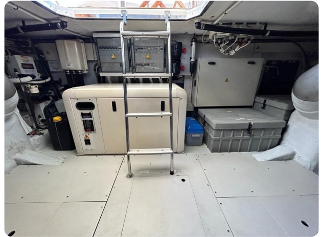
Az 62 Sala macchine - vista generatore