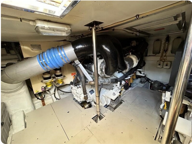
Az 62 Sala macchine.1