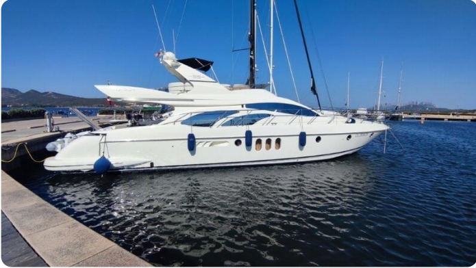
Az 62 Vista laterale