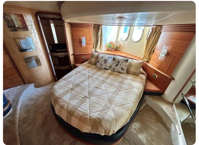
Az 62 Cabina armatoriale