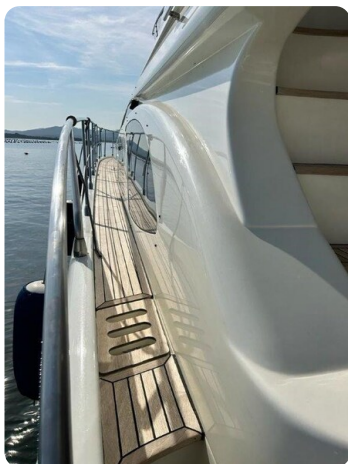
Az 62 Vista camminamento laterale