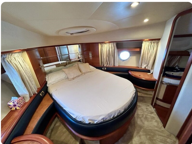
Az 62 Cabina VIP