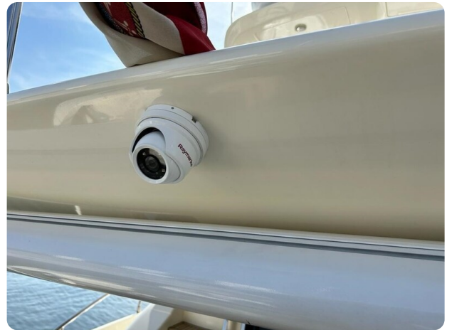
Az 62 Telecamera poppa