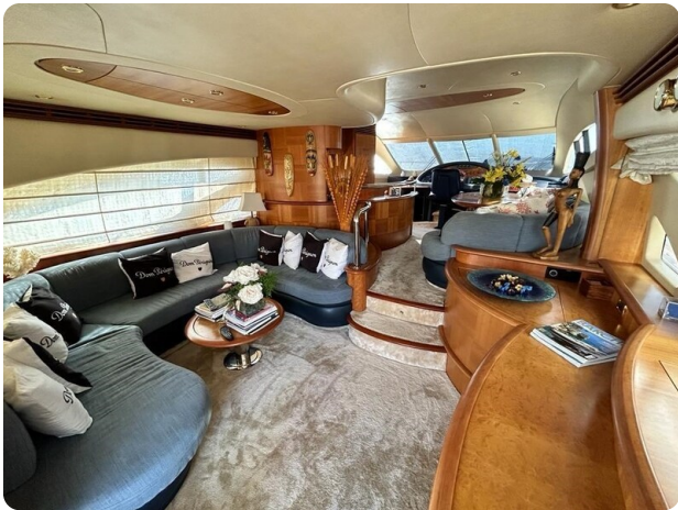
Az 62 Vista salone