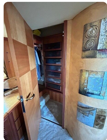
Az 62 Cabina armadio - cabina armatore