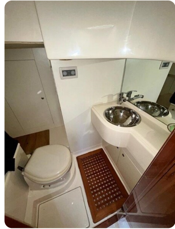
Az 62 Bagno cabina marinaio