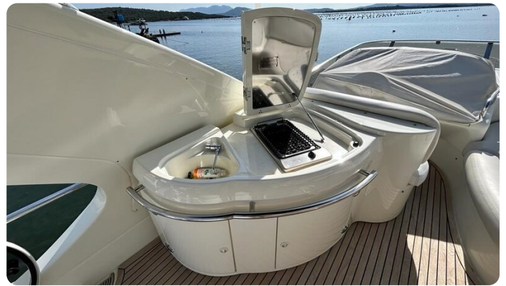
Az 62 Mobile cucina flybridge