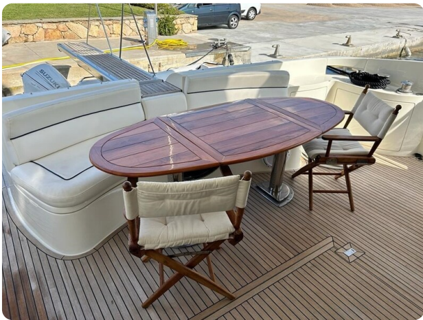
Az 62 Vista pozzetto