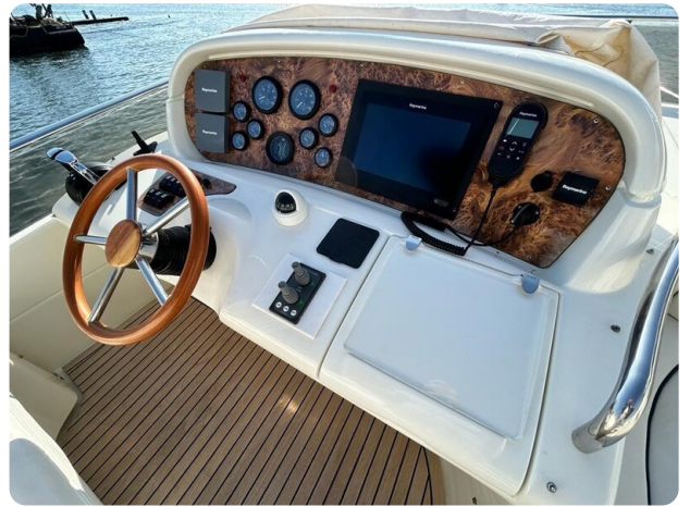
Az 62 Plancia di guida flybridge