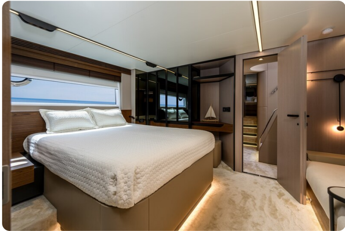
Azimut S7New, owner's cabin