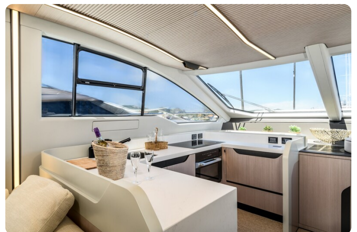
Azimut S7New galley