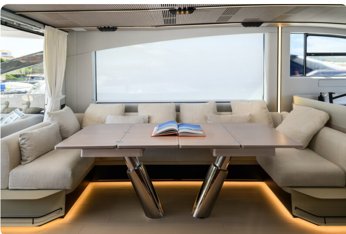
Azimut S7New dinette detail