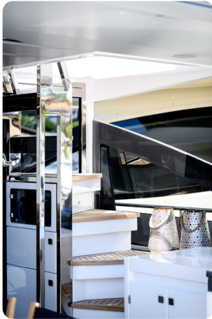
Azimut S7New cockpit stairs