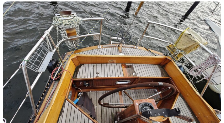
Baltika Decksalon SY 12