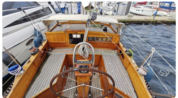
Baltika Decksalon SY 14