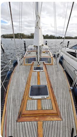
Baltika Decksalon SY 6