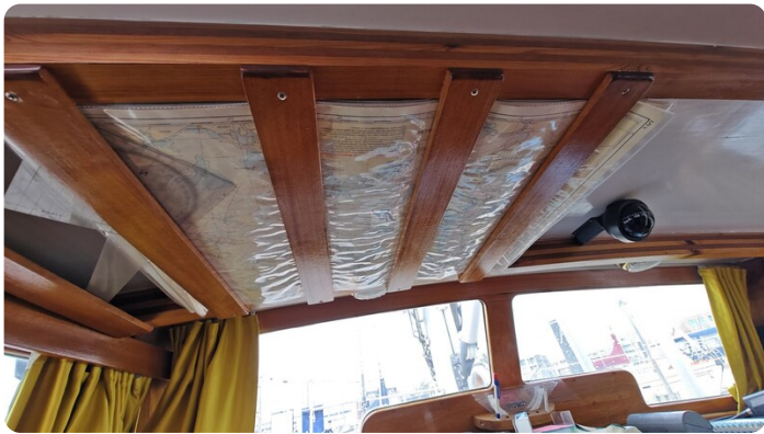
Baltika Decksalon SY 29