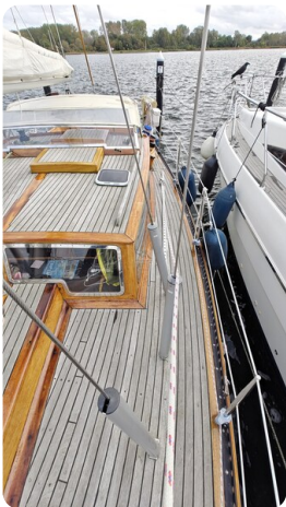
Baltika Decksalon SY 10