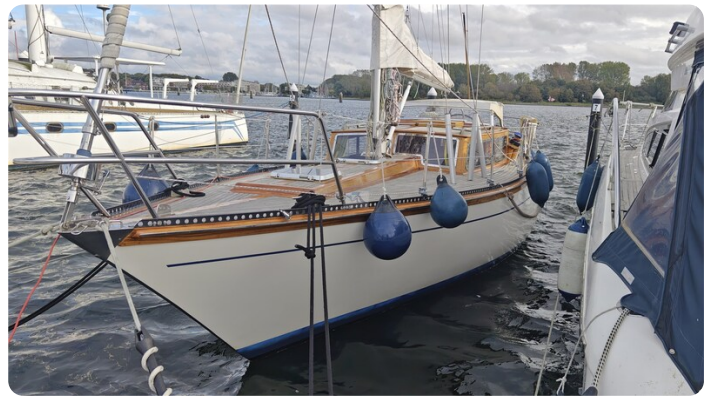
Baltika Decksalon SY 4