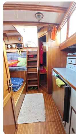
Baltika Decksalon SY 27