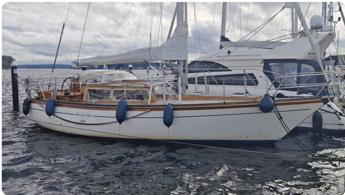
Baltika Decksalon SY 2