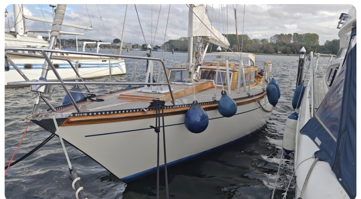
Baltika Decksalon SY 4