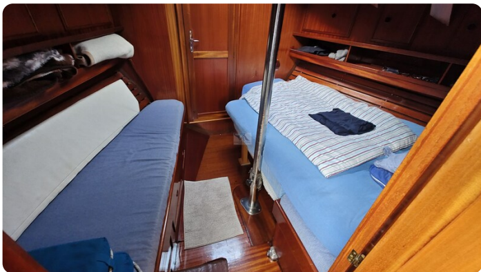
Baltika Decksalon SY 24