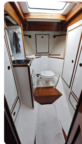
Baltika Decksalon SY 25