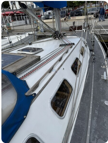
Baron 38 DER LETZTE BARON 34