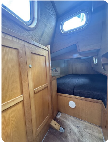
Baron 38 DER LETZTE BARON 62