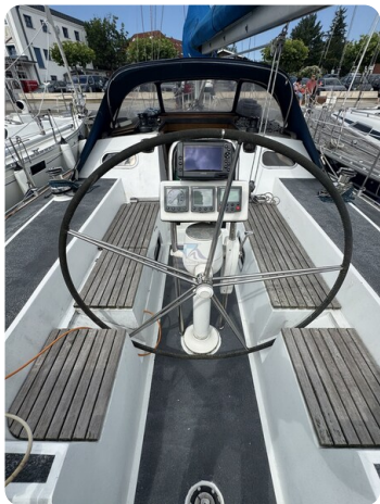
Baron 38 DER LETZTE BARON 43