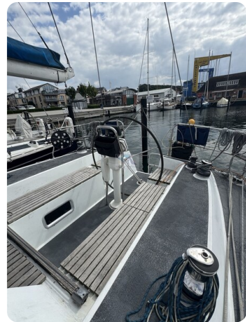
Baron 38 DER LETZTE BARON 46