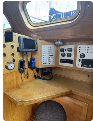
Baron 38 DER LETZTE BARON 75