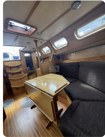
Baron 38 DER LETZTE BARON 52