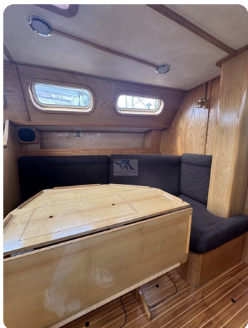
Baron 38 DER LETZTE BARON 59