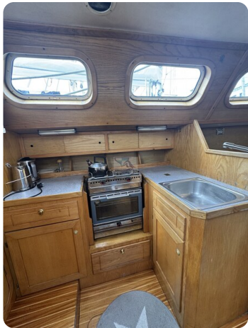
Baron 38 DER LETZTE BARON 71