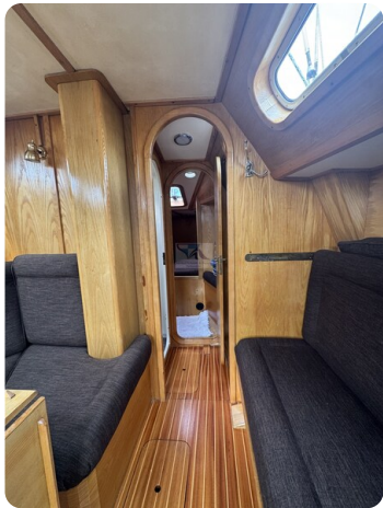
Baron 38 DER LETZTE BARON 58