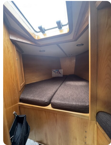
Baron 38 DER LETZTE BARON 55