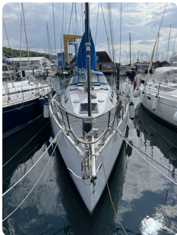
Baron 38 DER LETZTE BARON 23