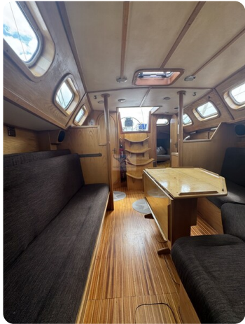
Baron 38 DER LETZTE BARON 53