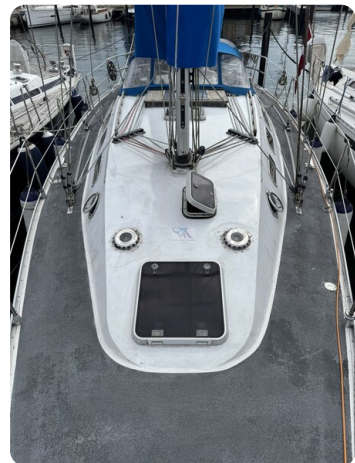
Baron 38 DER LETZTE BARON 30