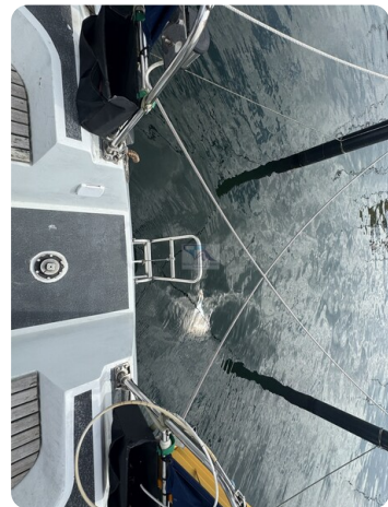
Baron 38 DER LETZTE BARON 44