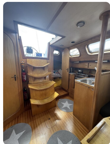
Baron 38 DER LETZTE BARON 51