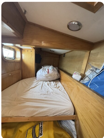
Baron 38 DER LETZTE BARON 68