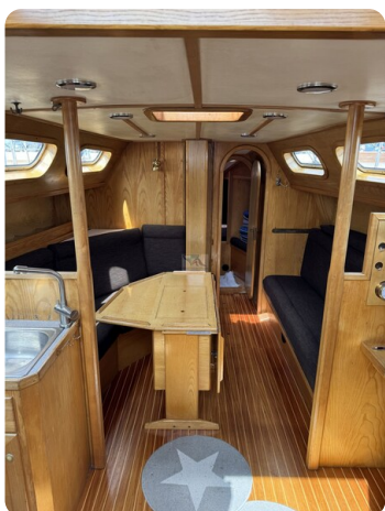
Baron 38 DER LETZTE BARON 76