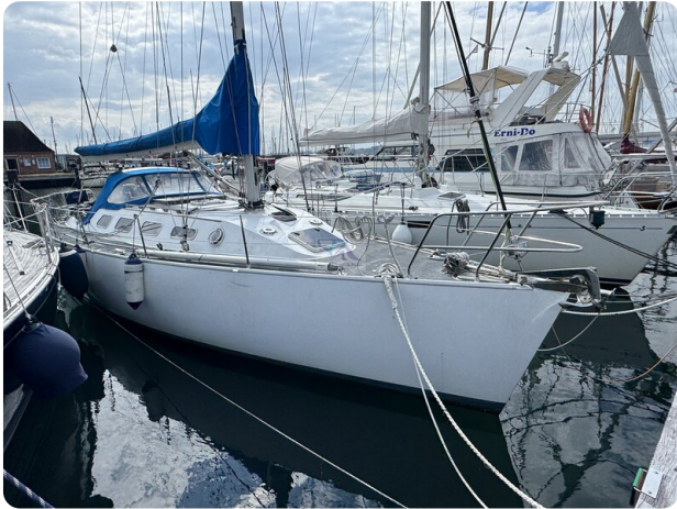
Baron 38 DER LETZTE BARON 20