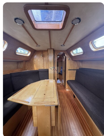
Baron 38 DER LETZTE BARON 72