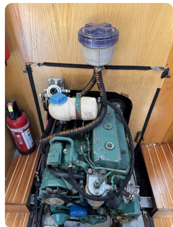
Baron 38 DER LETZTE BARON 6