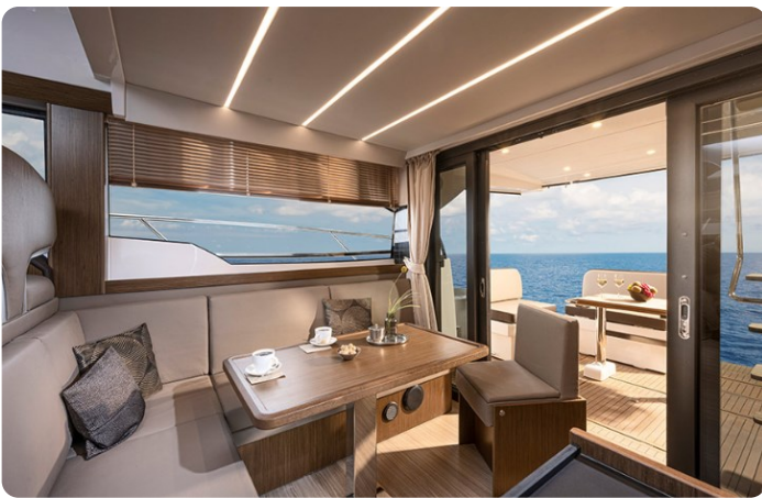
Bavaria 420 coupè dinette