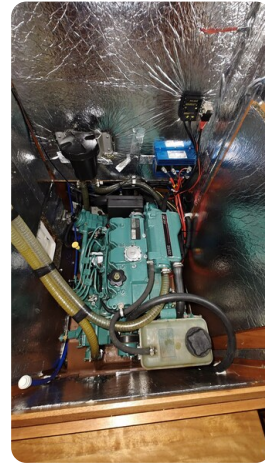
Bavaria 37 msp749314 23