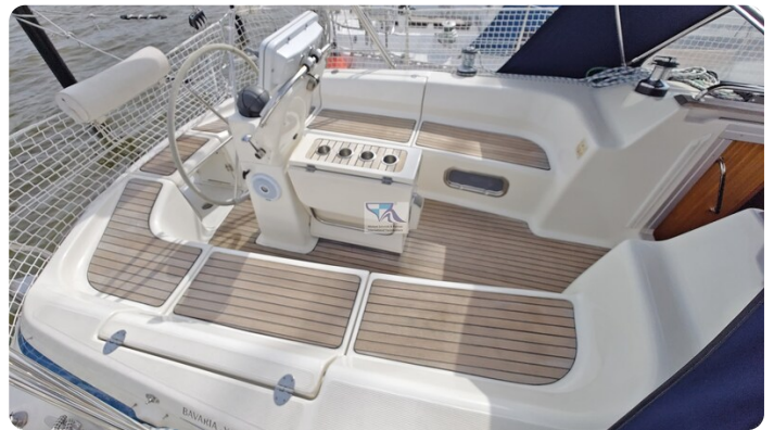
Bavaria 37_msp 60