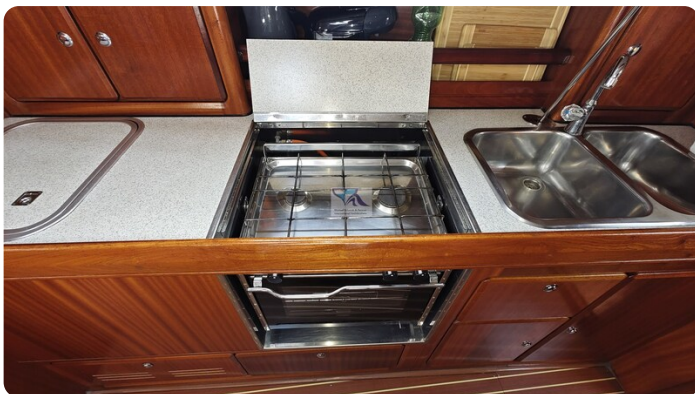
Bavaria 37_msp 31