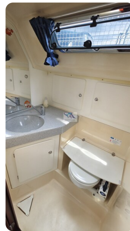
Bavaria 37_msp 18