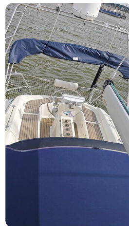
Bavaria 37_msp 57