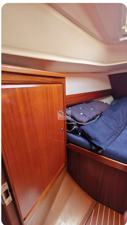
Bavaria 37_msp 23