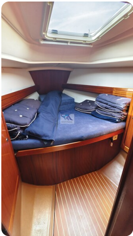
Bavaria 37_msp 21