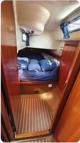
Bavaria 37_msp 17