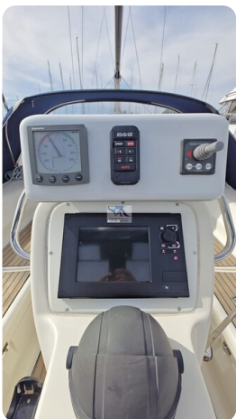
Bavaria 37_msp 66