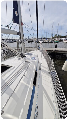
Bavaria 37_msp 35