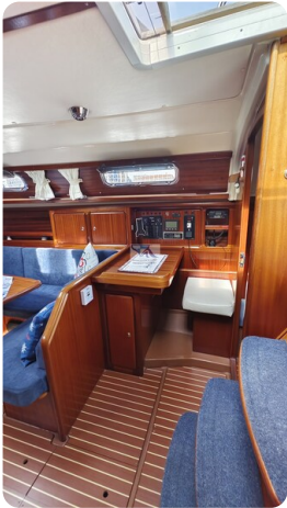
Bavaria 37_msp 7