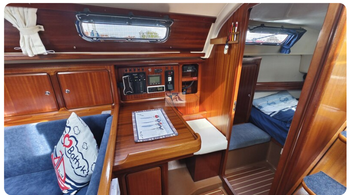
Bavaria 37_msp 15