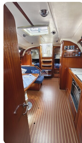
Bavaria 37_msp 24