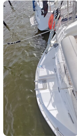
Bavaria 37_msp 64