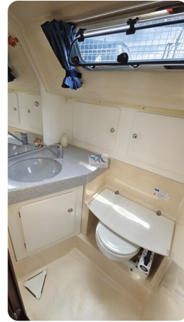
Bavaria 37_msp 18