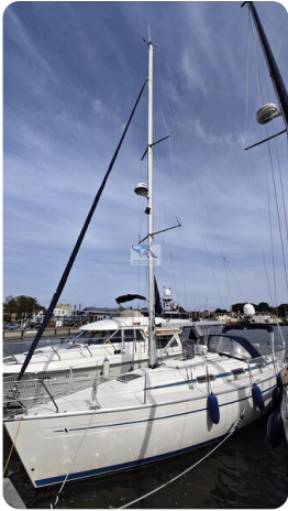
Bavaria 37_msp 51