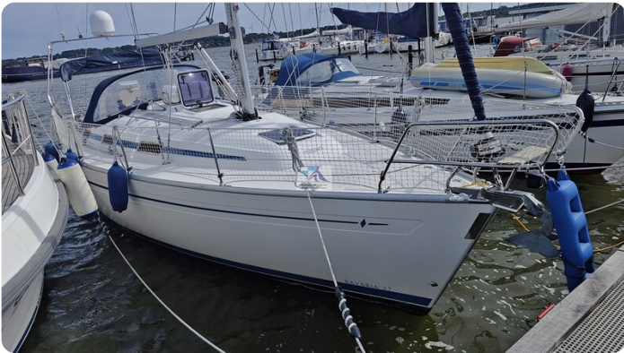
Bavaria 37_msp 49