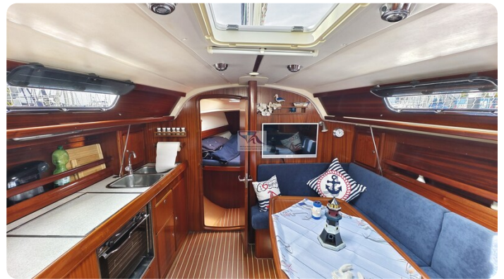
Bavaria 37_msp 20