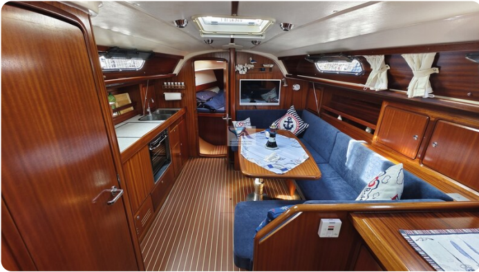
Bavaria 37_msp 11