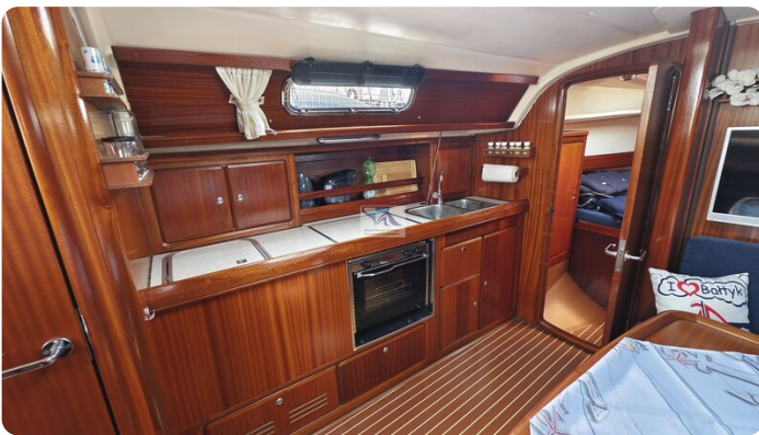
Bavaria 37_msp 14