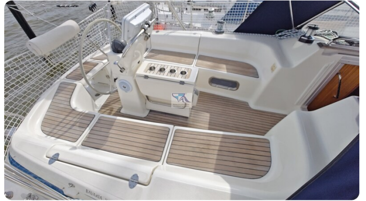
Bavaria 37_msp 60