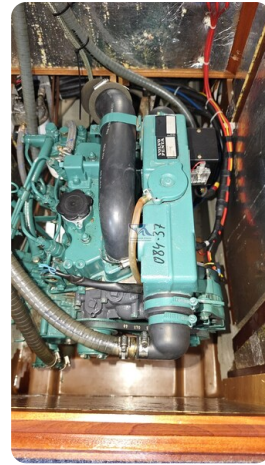
Bavaria 37_msp 25