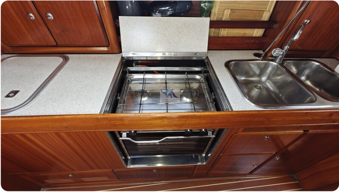
Bavaria 37_msp 31