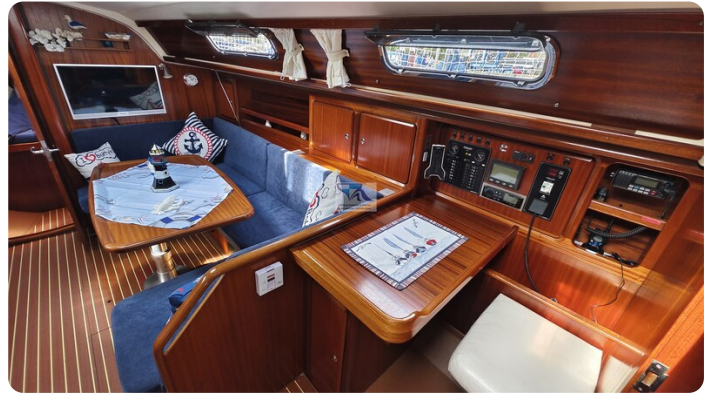
Bavaria 37_msp 12