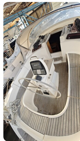
Bavaria 37 msp749314 8