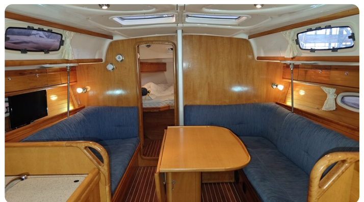
Bavaria 37 msp749314 12