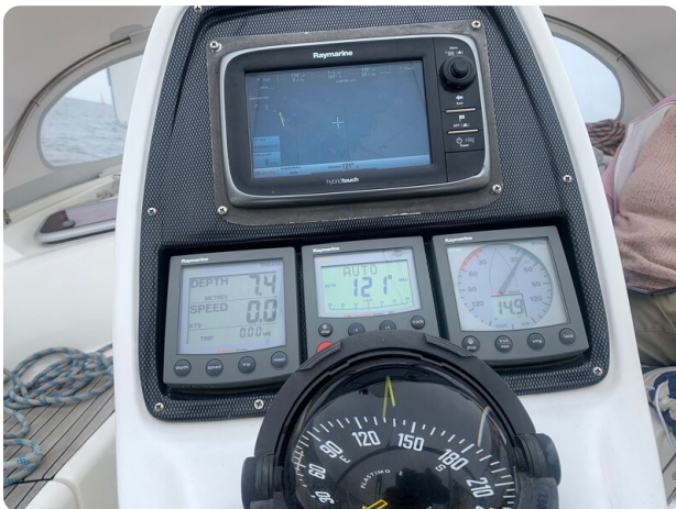
Bavaria 37 msp749314 10