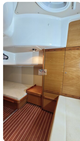
Bavaria 37 Sport msp793423 49