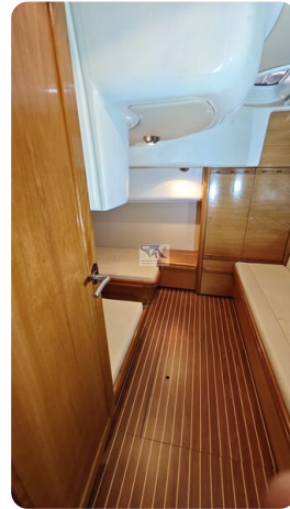
Bavaria 37 Sport msp793423 47