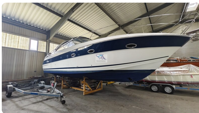
Bavaria 37 Sport msp793423 4