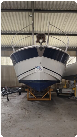
Bavaria 37 Sport msp793423 6