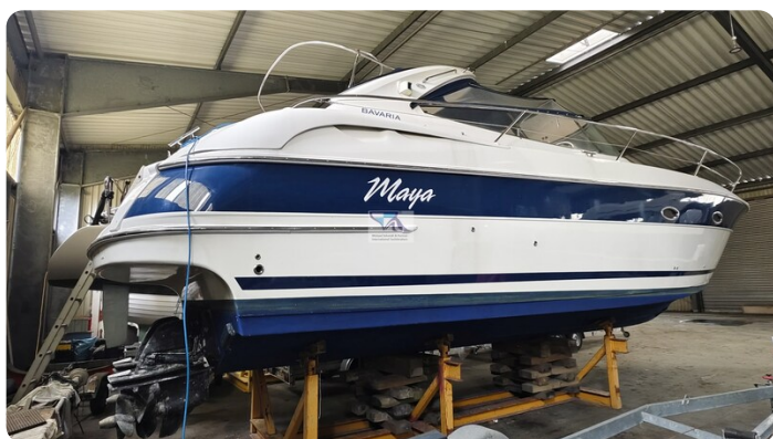
Bavaria 37 Sport msp793423 1