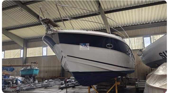
Bavaria 37 Sport msp793423 7