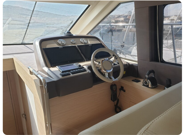
{1} Helm station