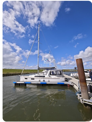
Oceanis 35.1 2