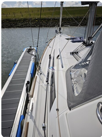
Oceanis 35.1 51