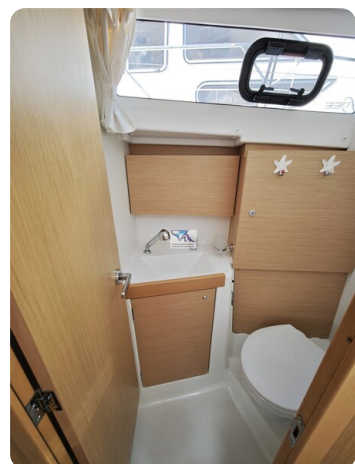
Oceanis 35.1 32