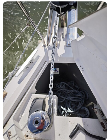
Oceanis 35.1 54