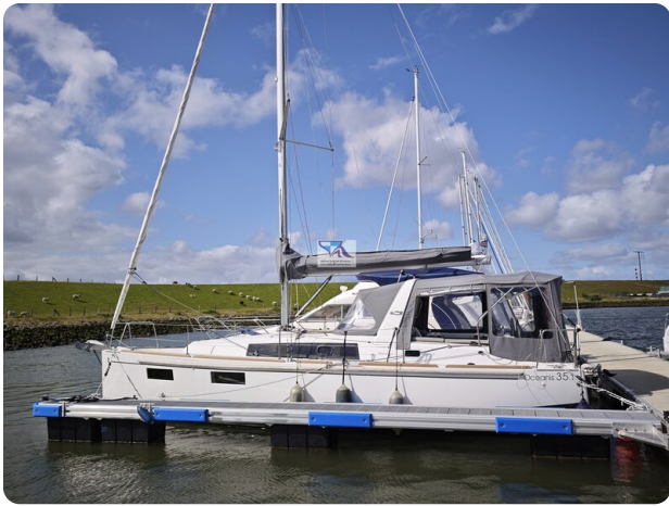
Oceanis 35.1 1