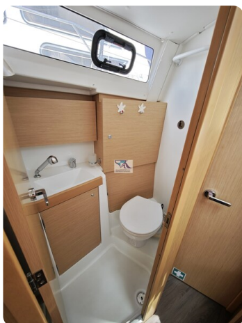
Oceanis 35.1 31