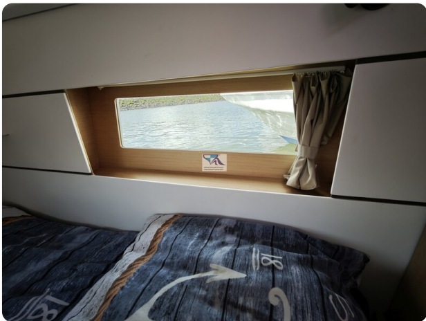
Oceanis 35.1 27