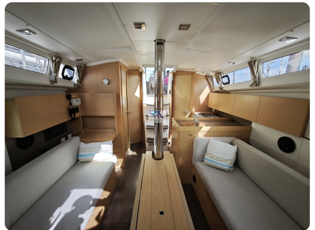
Oceanis 35.1 28