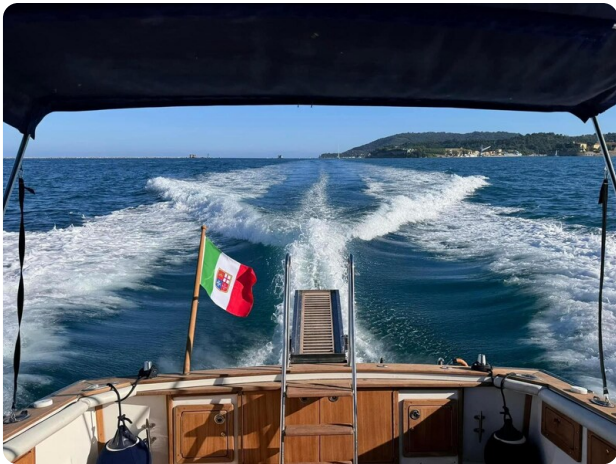
Bertram 28 Fbc running