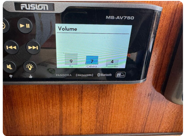
Bertram 28 Fbc Fusion stereo