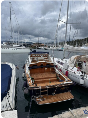
Bertram 28 Fbc aft profile