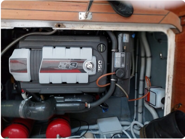
Bertram 28 Fbc new ercruiser engines