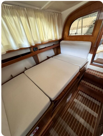
Bertram 28 Fbc convertible dinette