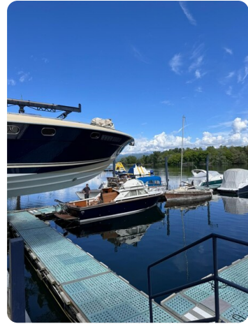
Bertram 28 Fbc profile