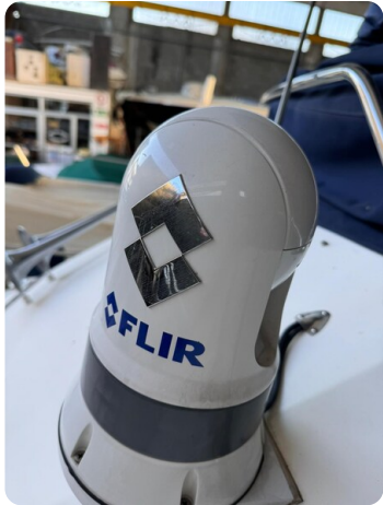
Bertram 28 Fbc flir