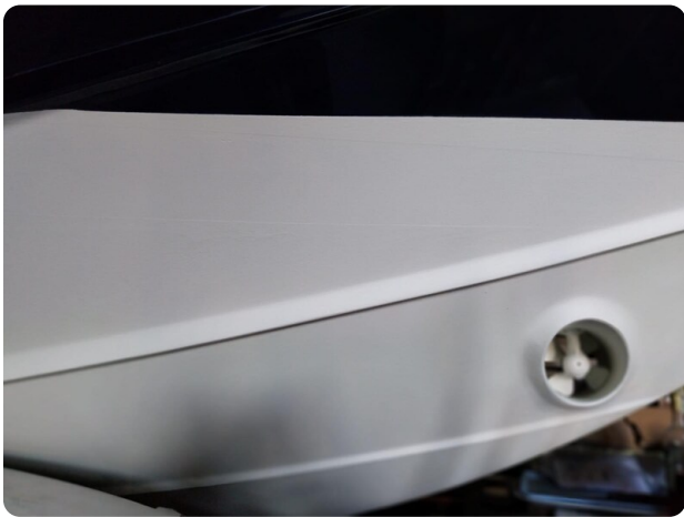
Bertram 28 Fbc bow thruster