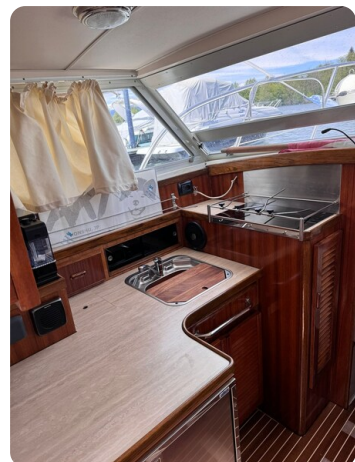
Bertram 28 Fbc galley