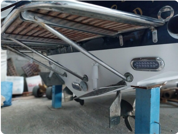
Bertram 28 Fbc underwater lights