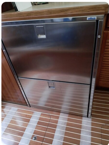
Bertram 28 Fbc fridge