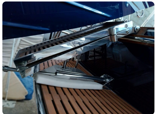
Bertram 28 Fbc gangway