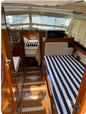
Bertram 28 Fbc interiors