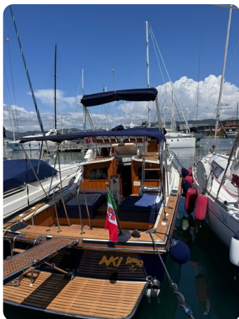
Bertram 28 Fbc view