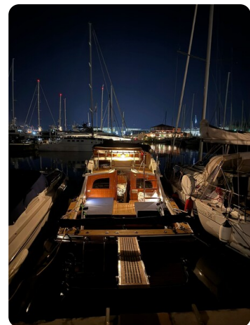
Bertram 28 Fbc night view