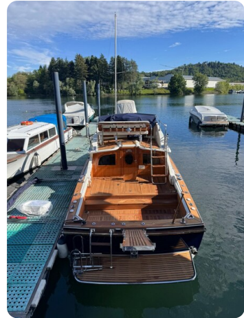
Bertram 28 Fbc stern view