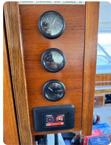
Bertram 28 Fbc details