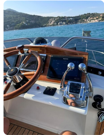
Bertram 28 Fbc helm