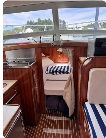
Bertram 28 Fbc cabin view