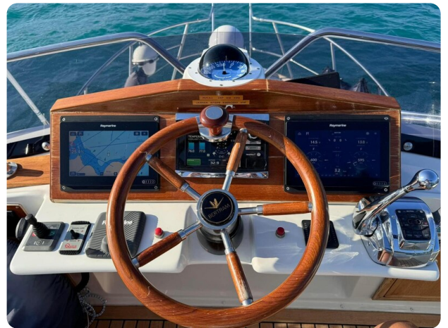
Bertram 28 Fbc helm station