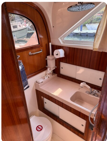
Bertram 28 Fbc bathroom