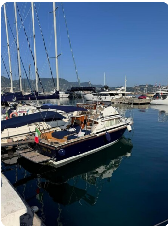
Bertram 28 Fbc aft view