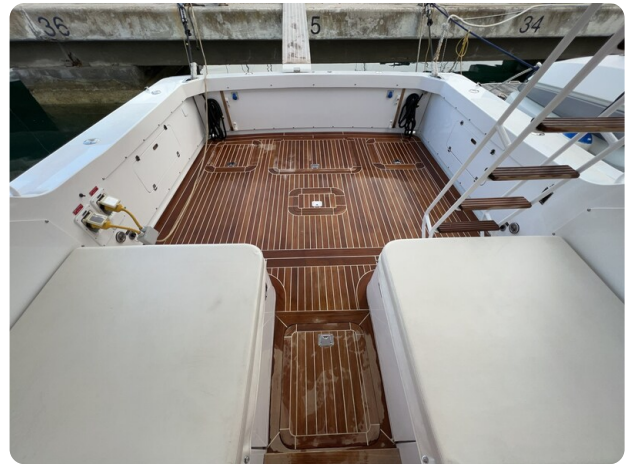
Bertram 33 Sport Fisherman