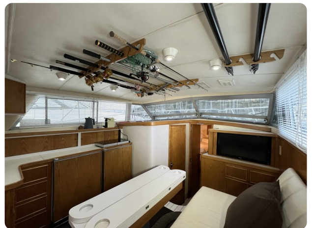
Bertram 33 Sport Fisherman8