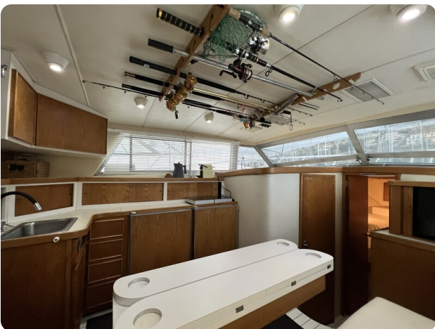
Bertram 33 Sport Fisherman9