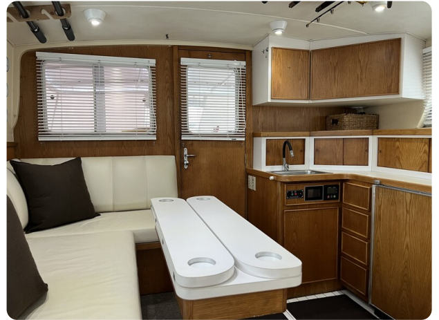
Bertram 33 Sport Fisherman12