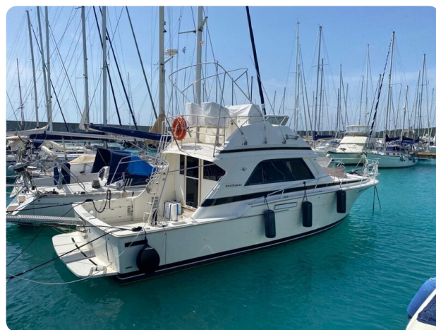
Bertram 37, moored