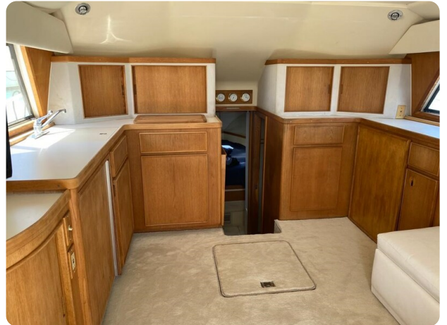
Bertram 37, salon