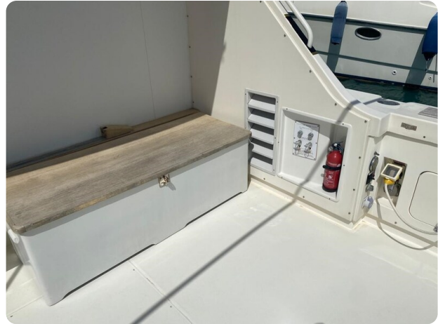
Bertram 37, cockpit detail