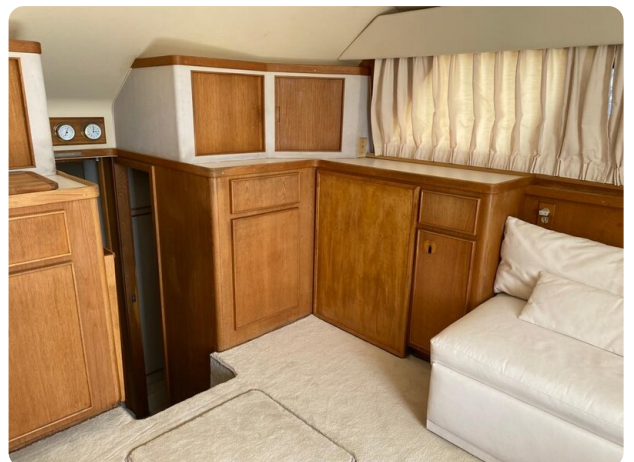
Bertram 37, salon detail