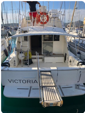
Bertram 37, aft view