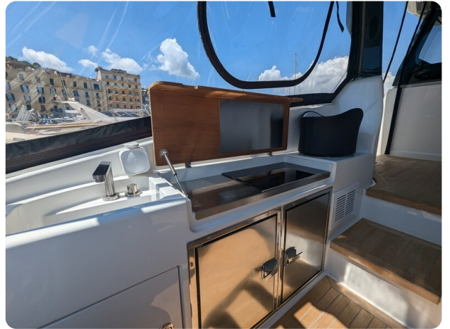
Bluegame 42 cockpit galley