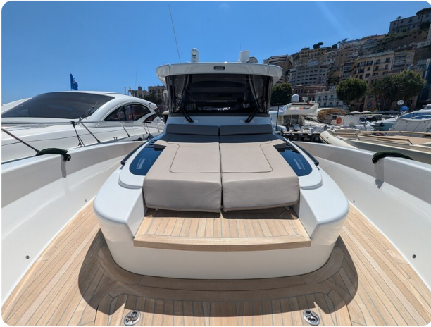
Bluegame 42 bow deck