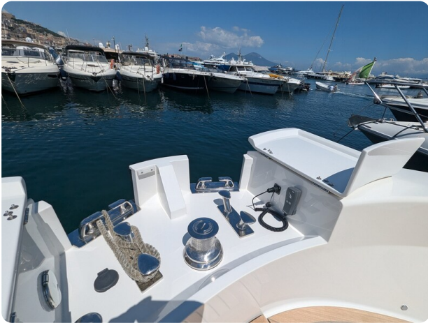
Bluegame 42 windlass detail