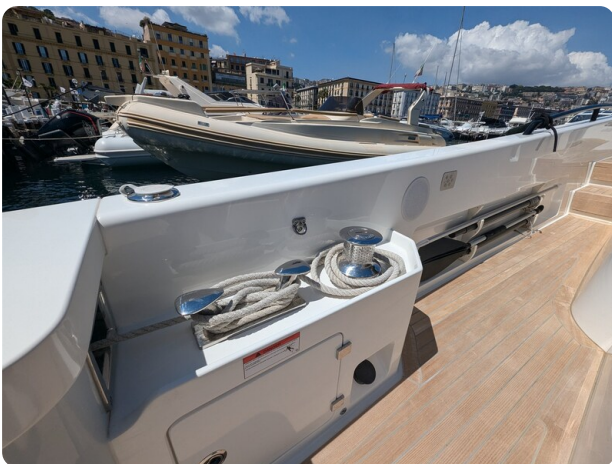
Bluegame 42 cockpit winches