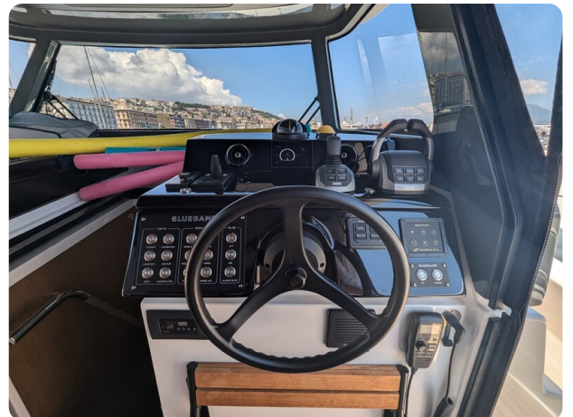
Bluegame 42 helm station