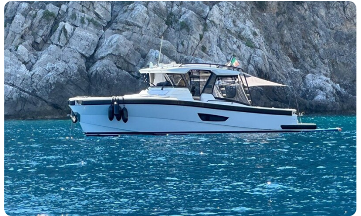
Bluegame 42 profile anchored 2