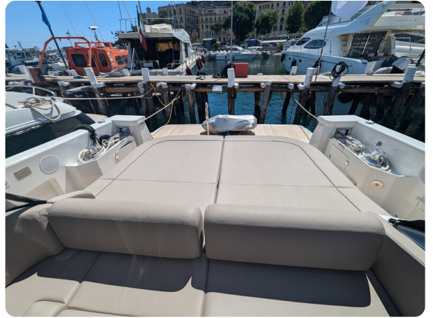
Bluegame 42 cockpit sunpad