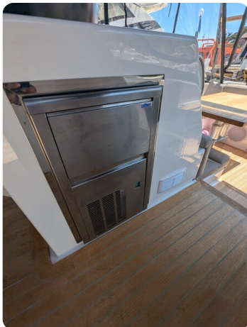
Bluegame 42 cockpit ice maker