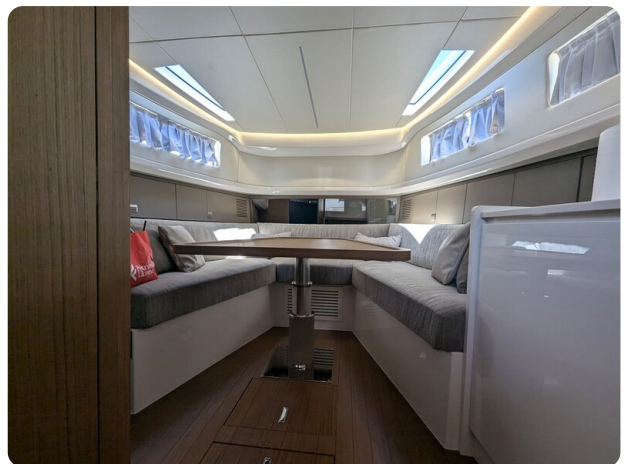
Bluegame 42 conv. dinette