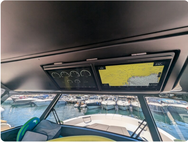
Bluegame 42 electronics