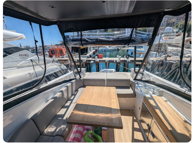
Bluegame 42 cockpit dinette