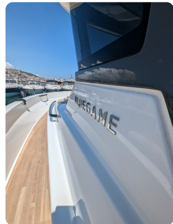
Bluegame 42 sideways detail