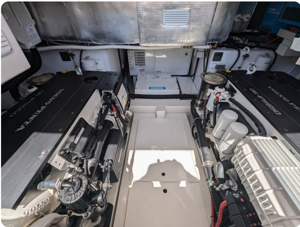
Bluegame 42 engine room