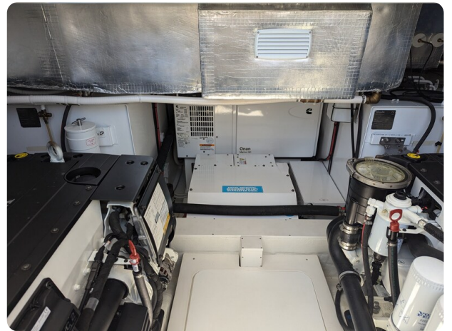
Bluegame 42 Onan generator