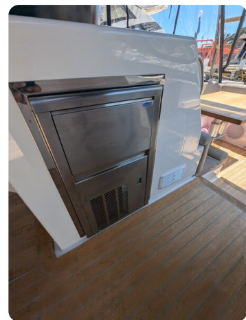
Bluegame 42 cockpit ice maker