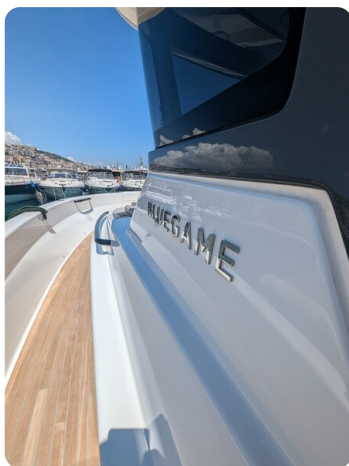
Bluegame 42 sideways detail