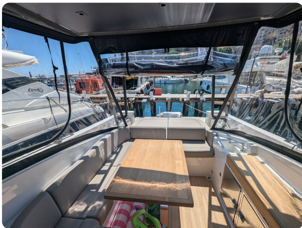
Bluegame 42 cockpit dinette