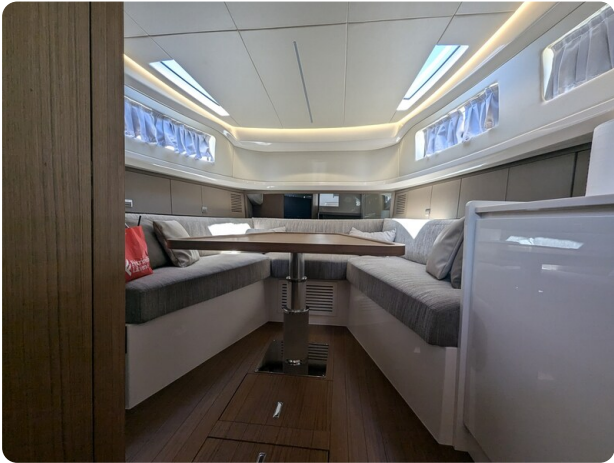
{1} Convertible dinette