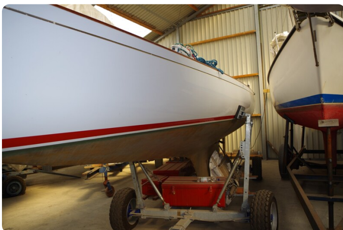
Schärenkreuzer FLORIAN 12