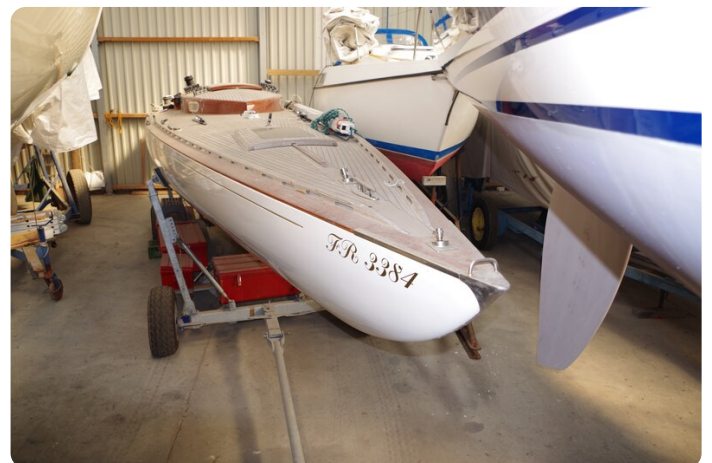
Schärenkreuzer FLORIAN 2