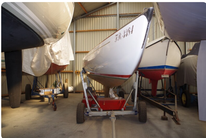
Schärenkreuzer FLORIAN 10