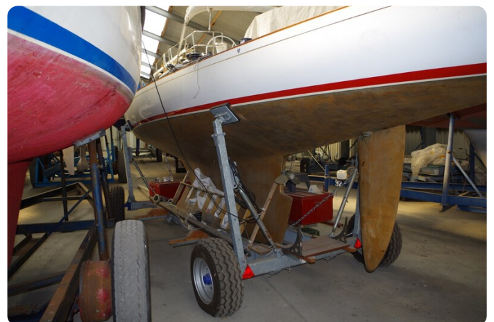
Schärenkreuzer FLORIAN 17