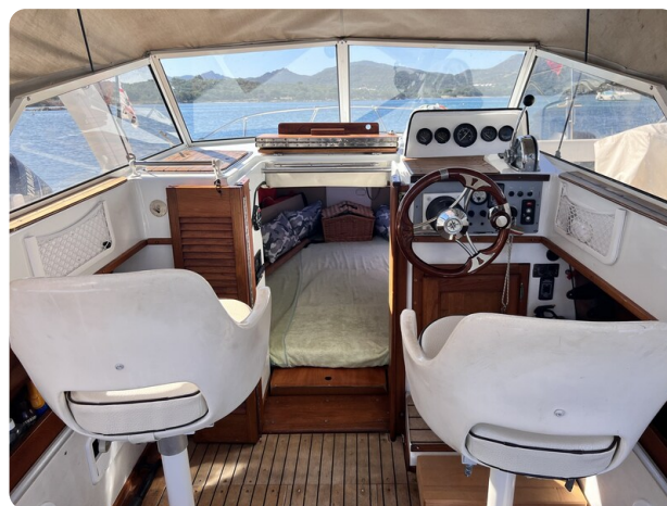
Boston Whaler 22 REVENGE