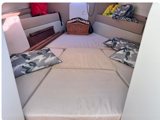
Boston Whaler 22 REVENGE