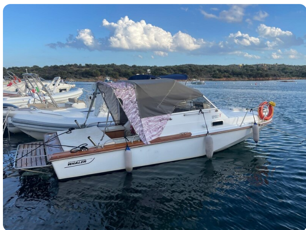
Boston Whaler 22 REVENGE