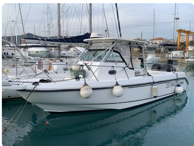
Boston 28 Outrage bow profile