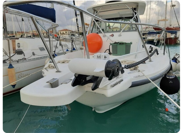
Boston 28 Outrage bow detail