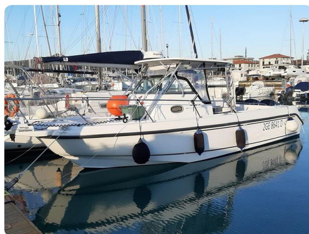
Boston 28 Outrage profile