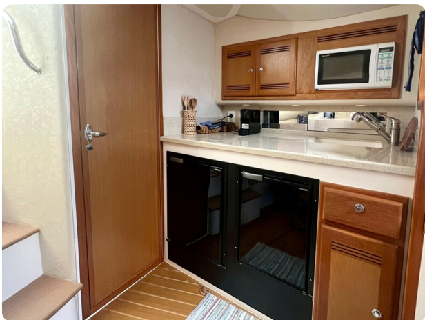
Cabo 32 Express galley