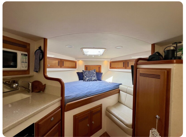
Cabo 32 Express cabin view