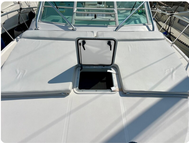
Cabo 32 Express fwd sunpad