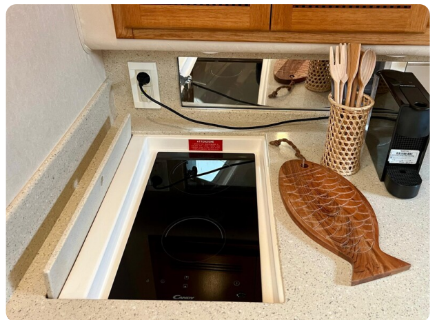
Cabo 32 Express cooktop