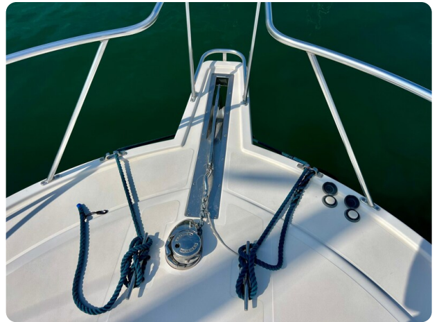
Cabo 32 Express bow pulpit