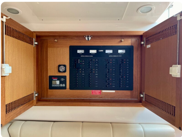
Cabo 32 Express electrical panel