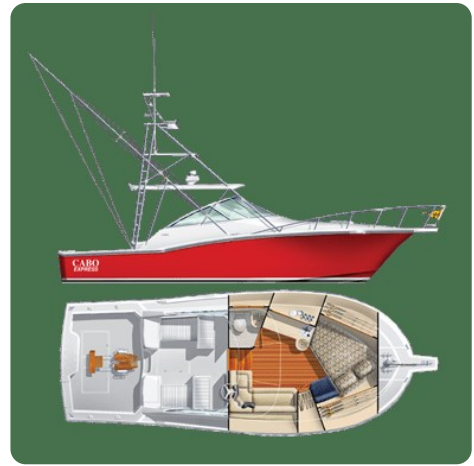
Cabo 32 Express, Layout