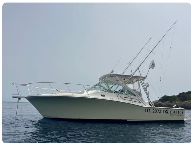
Cabo 32 Express, profile