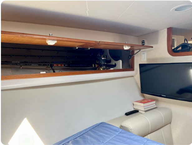
Cabo 32 Express dinette details