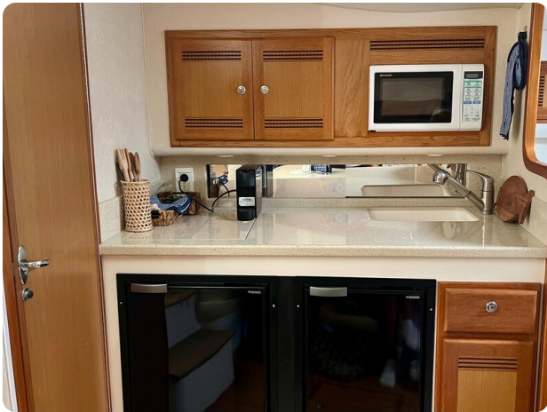
Cabo 32 Express galley view