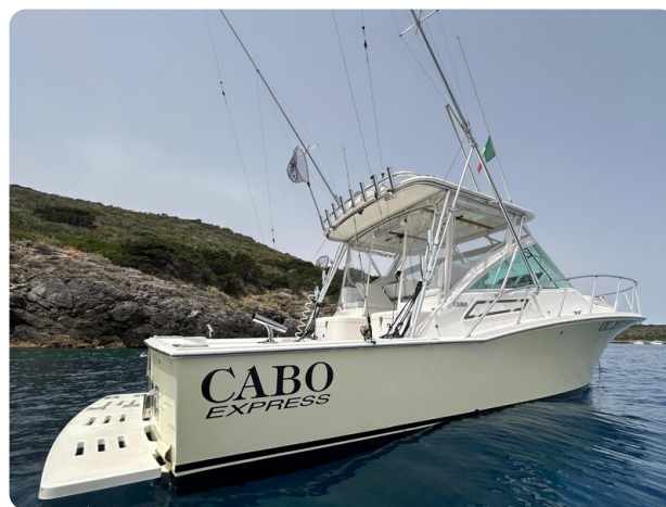
Cabo 32 Express, angle