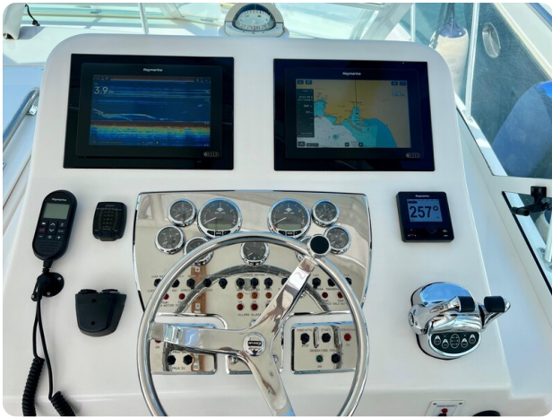
Cabo 32 Express helm