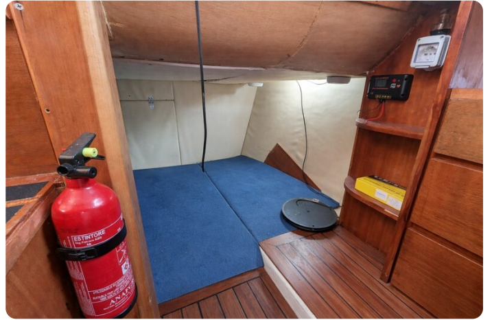
Canamer 33 aft cabin