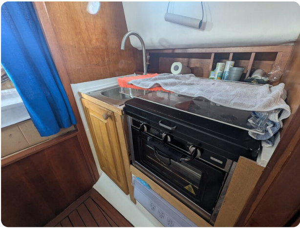
Canamer 33 galley