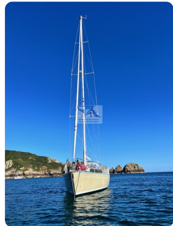
Grand Soleil 45 85