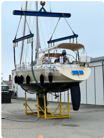
Grand Soleil 45 78