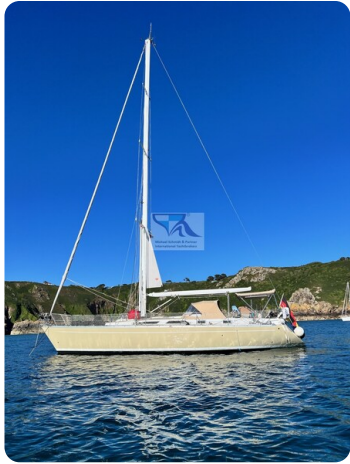
Grand Soleil 45 82