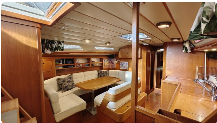
Grand Soleil 45 92