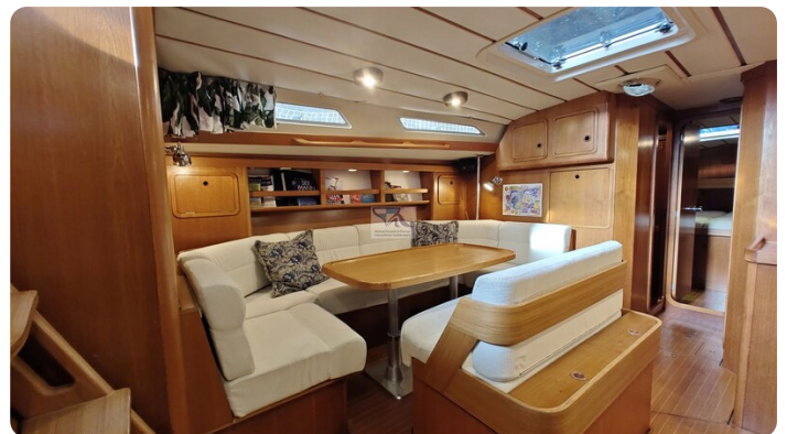
Grand Soleil 45 93