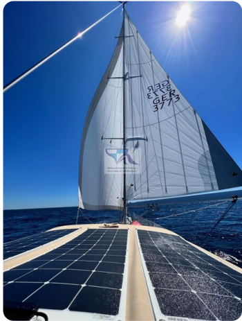
Grand Soleil 45 88