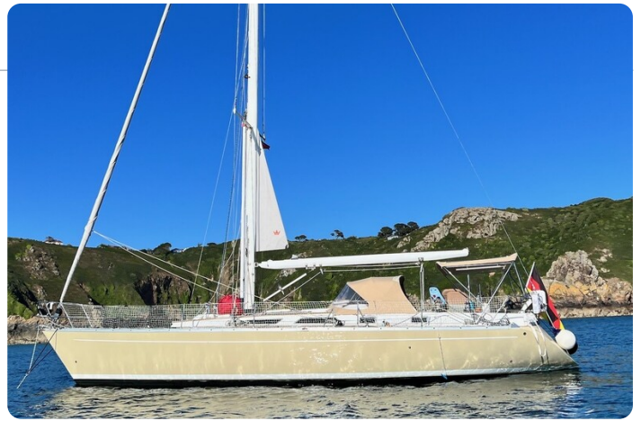
Grand Soleil 45 1