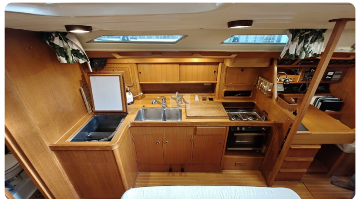
Grand Soleil 45 101