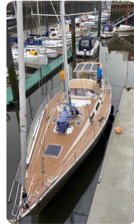
Grand Soleil 45 70