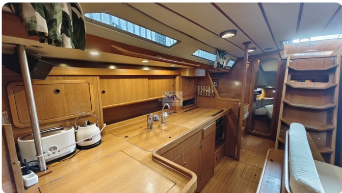
Grand Soleil 45 99