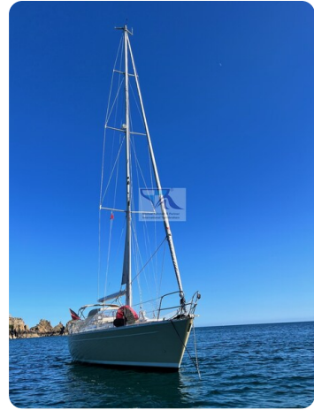
Grand Soleil 45 86