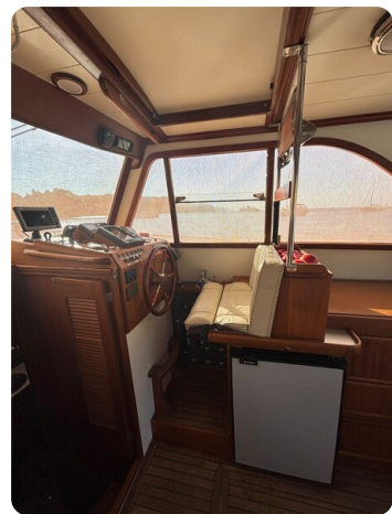
Helm station 1