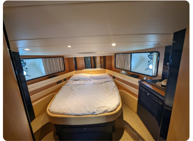
Sarnico 58 owner's cabin