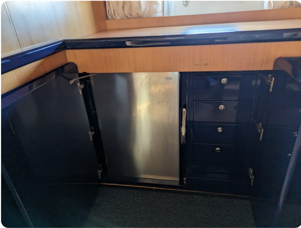
Sarnico 58 galley detail