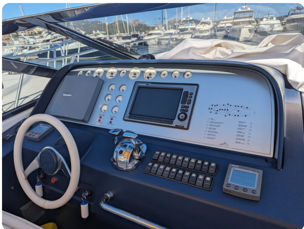
Sarnico 58 helm station