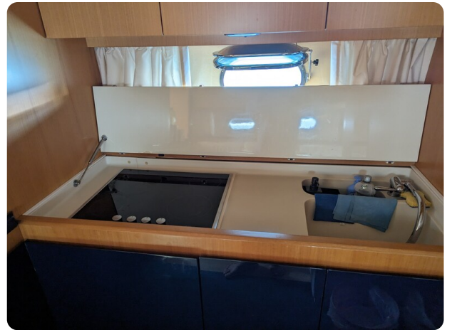
Sarnico 58 galley