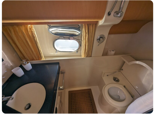
Sarnico 58 guest bathroom