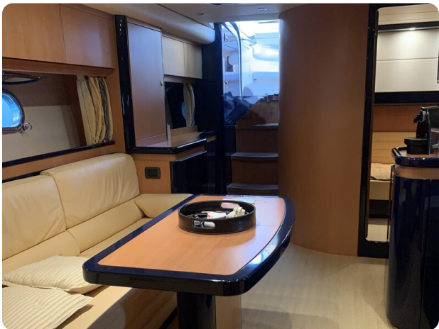
Sarnico 58 salon