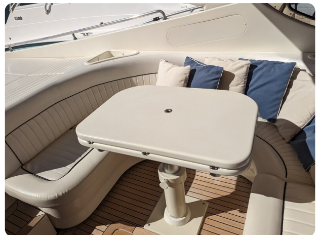
Sarnico 58 cockpit dinette