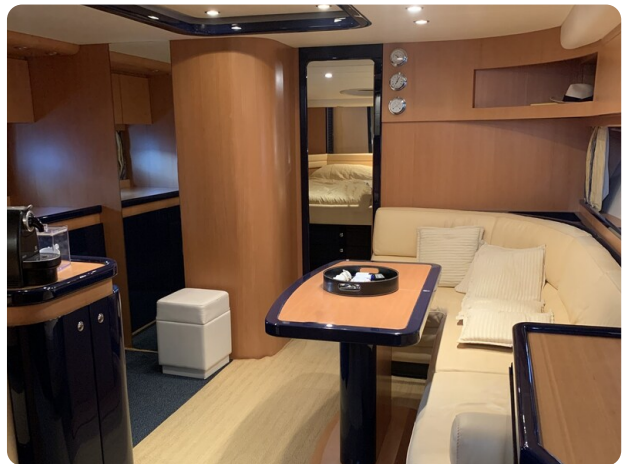
Sarnico 58 salon