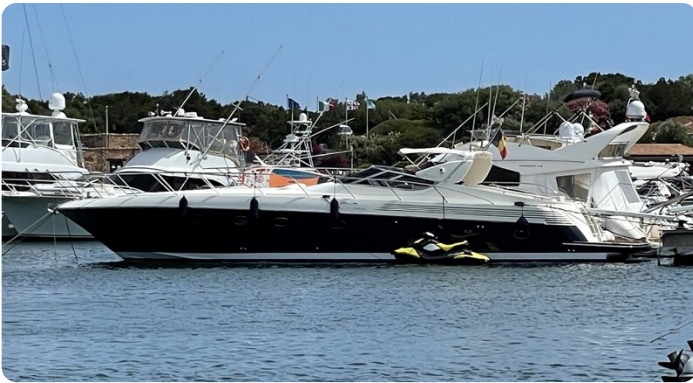
Sarnico 58 profile