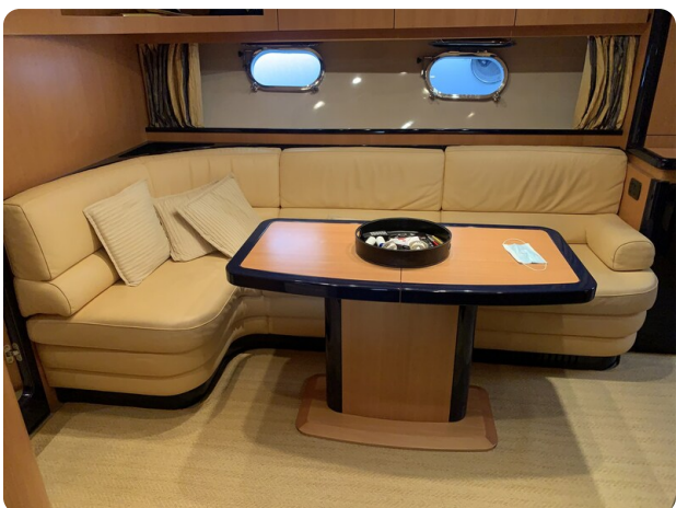
Sarnico 58 salon dinette