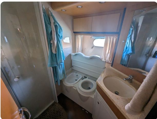
Sarnico 58 owner's bathroom