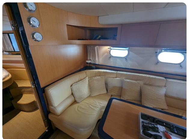
Sarnico 58 salon detail