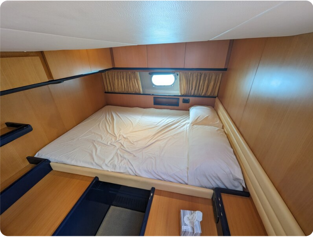
Sarnico 58 Vip cabin