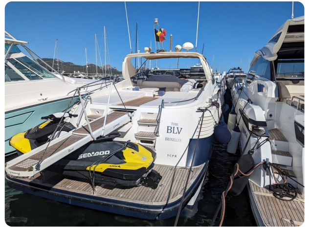
Sarnico 58 aft view