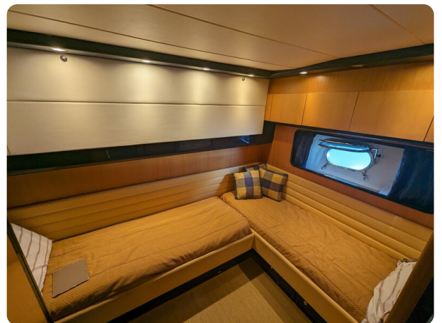
Sarnico 58 guest L cabin