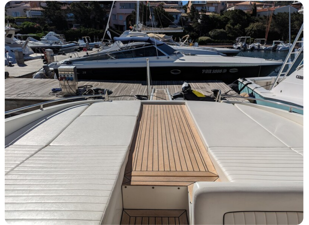
Sarnico 58 aft sunpad