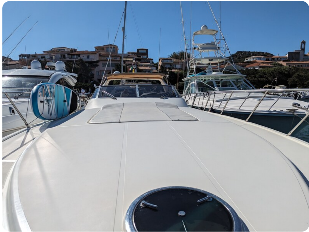
Sarnico 58 bow view