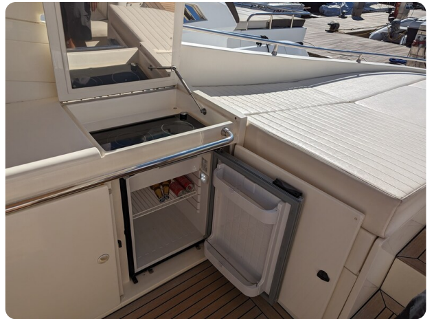
Sarnico 58 cockpit galley