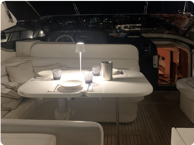
Sarnico 58 night view