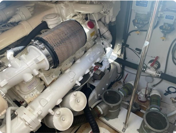
Sarnico 58 engine