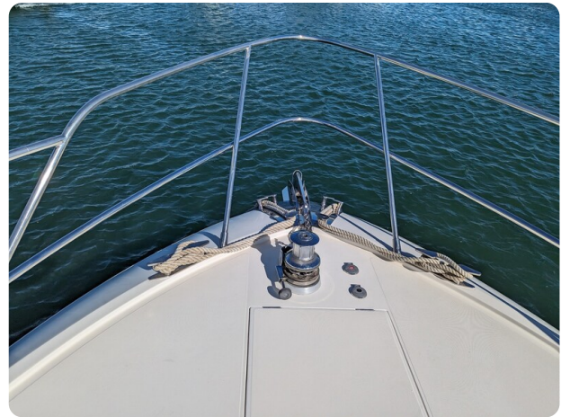
Sarnico 58 bow deck