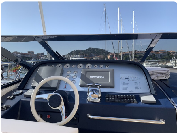
Sarnico 58 helm