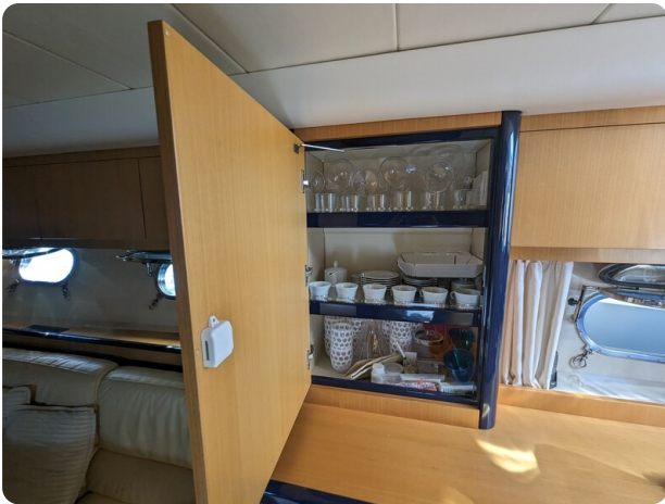
Sarnico 58 salon detail