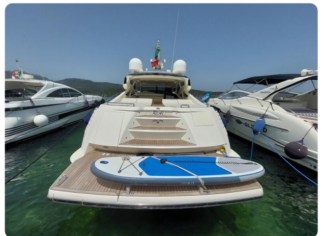
Sarnico 60 RiAl aft view