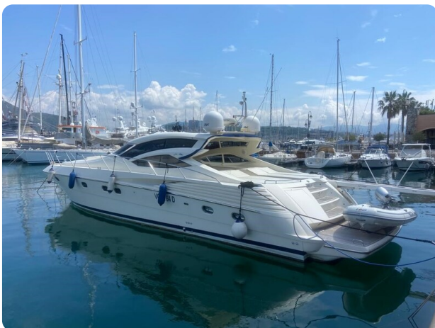
Sarnico 60 profile