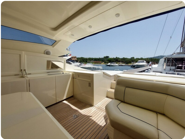
Sarnico 60 RiAl pics 123141