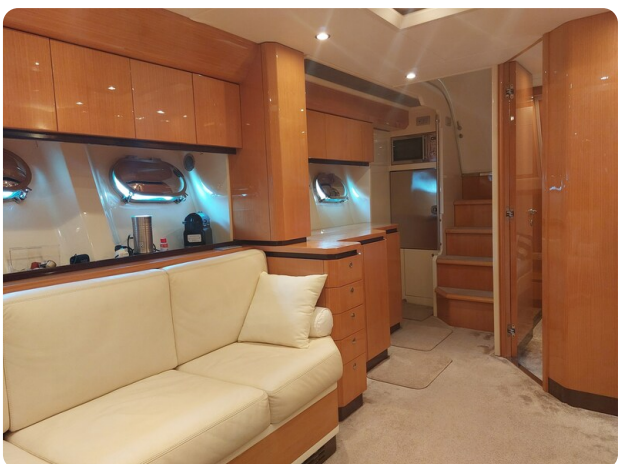
Sarnico 60 RiAl dinette and galley