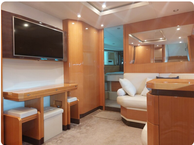
Sarnico 60 RiAl interior salon