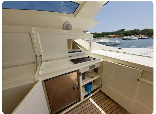
Sarnico 60 RiAl pics 123202