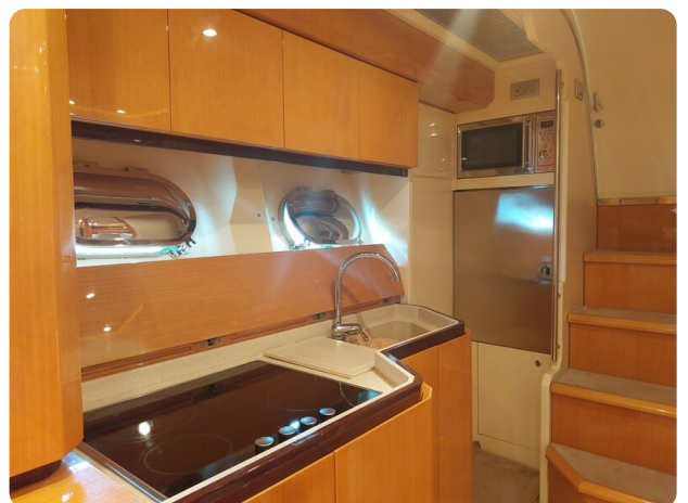
Sarnico 60 RiAl interior galley