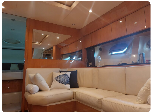
Sarnico 60 RiAl interior salon (1)