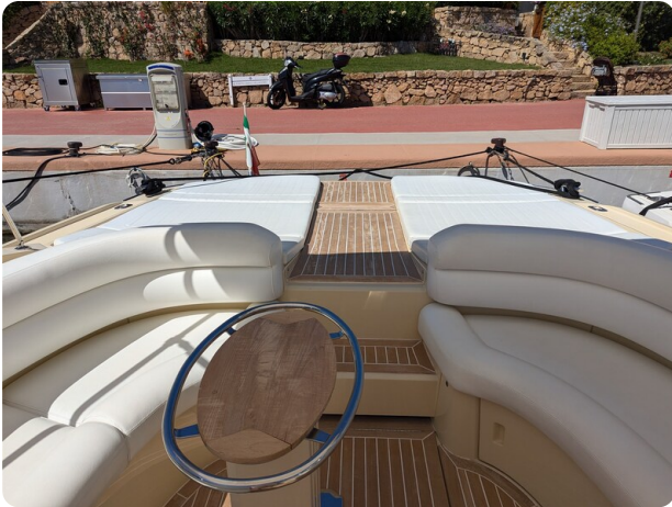
Sarnico Spider cockpit view